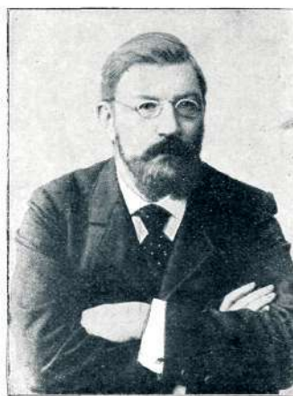
DR. F. N. MILJUKOV, voditelj kadetov v ruski dumi