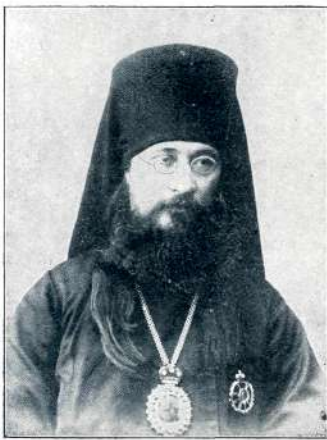
ARHIEREJ EVLOGIJ, voditelj konservativcev v ruski dumi