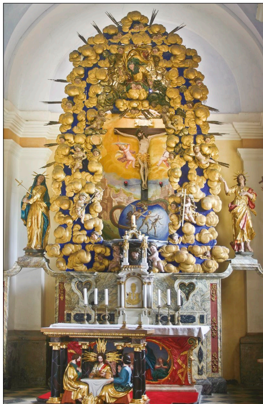
2. Frančiškanska rezbarska delavnica: veliki oltar, okoli 1718, Puštal pri Škofji Loki, podružnična cerkev sv. Križa na Hribcu