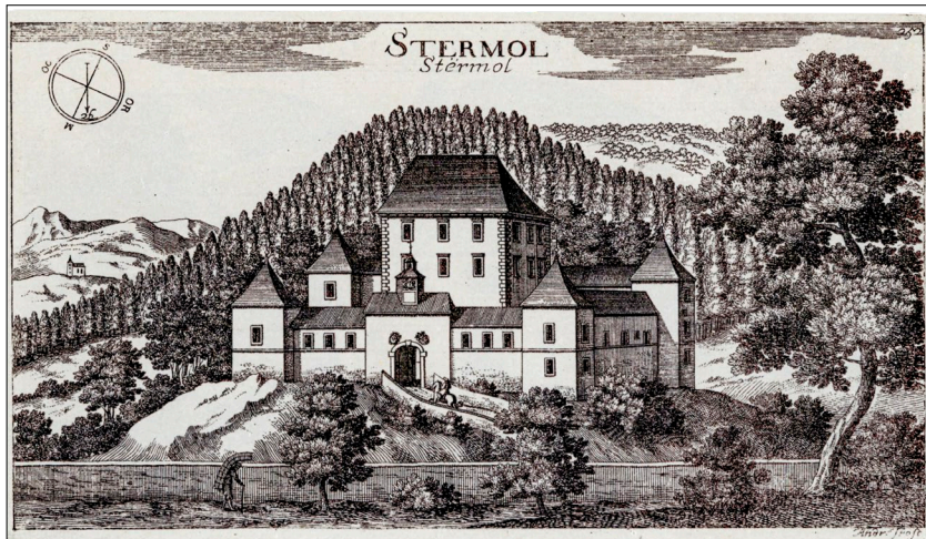
3. Grad Strmol, veduta v Valvasorjevi Topografiji Kranjske