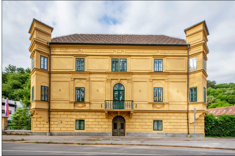
11. Galetov grad, Ljubljana Šiška