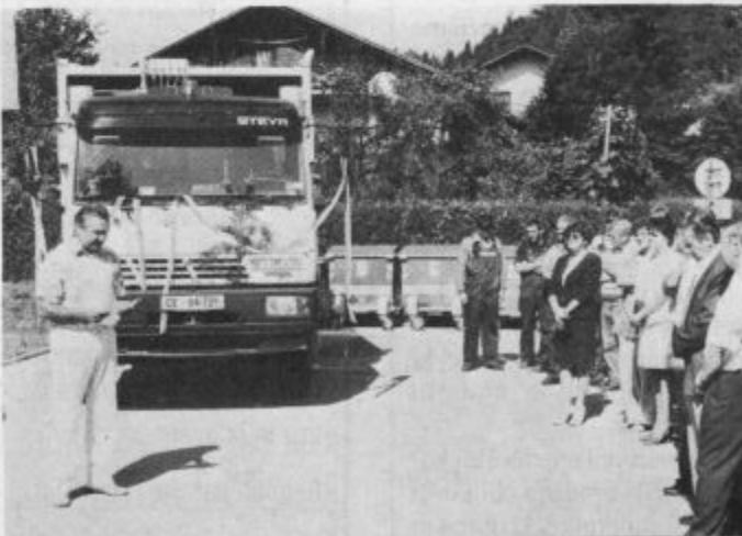
Novo vozilo je trdna podlaga za nadaljnje novosti pri ravnanju z odpadki