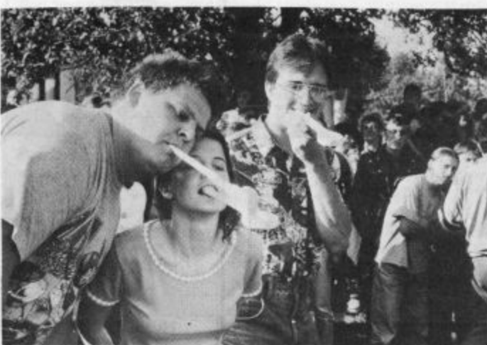
Praznika brez šaljivih iger ne sme in ne more biti. Za tekmovalce in tekmovalke 7 ekip so bila nekatere med njimi kar naporne, za številne obiskovalce pa seveda razburljive, predvsem pa šaljive: vlečenje vrvi, žaganje hloda, prevoz tekmovalke s samokolnico, hoja hrbtno po vseh štirih. Nošenje jajca z leseno žlico (razkužili so jo seveda z domačim žganjem) je bilo le za najspretnейše...

Ni ji jih bilo malo, ki so si želeli ogledati tudi nedeljski del prireditve. Člani šmihelskega aktiva Društva podeželske mladine so ga namenili šaljivim igram med ekipami mladih iz Zgornje