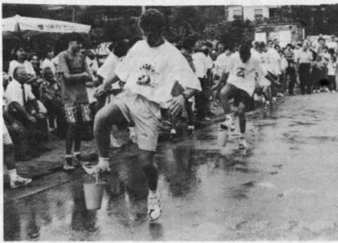
"Buteji" se tokrat niso posebno izkazali, tudi pri prenašanju vode ne.

curkom v gol) so bile za nekatere sodelujoče kar naporne. Nič drugače ni bilo z igro presenečenja. Člani ekip so namreč morali na odru predstavljati znane slovenske pevce in pevke.