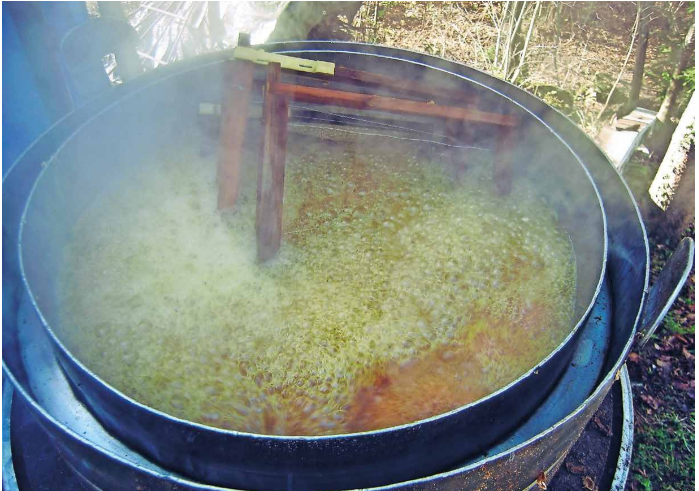
Pri prekuhavanju satnikov v vrelem lugu je nujna ustrezna zaščitna oprema.

tako da z njih med razkuževanjem odpadejo nečistoče ter ostanki voščin, propolisa in starega satovja, sam postopek pa tudi poskrbi za uničenje morebitnih spor hude gnilobe in drugih bolezenskih klic. Ker nam september daje še veliko suhih, toplih in zračnih dni, se bodo pred zimo tako prekuhani in s tekočo vodo pod pritiskom splaknjeni satniki brez težav osušili in bodo pripravljene za skladiščenje, ne da bi lesu zaradi vlage grozil napad plesni. Pri sušenju je treba take satnike vpeti v »prešo« ali ustrezno obtežiti, sicer se pri sušenju zvijejo in so neuporabni. Že ožičeni satniki, pri katerih je praviloma pred ponovno uporabo potreben samo kakšen manjši tehnični popravek, pa nam bodo spomladi, ko teče glede razpoložljivih delovnih ur najbolj voda v grlo, prihranili veliko dragocenega časa ob pripravi na novo sezono. S tem pa se dodana vrednost