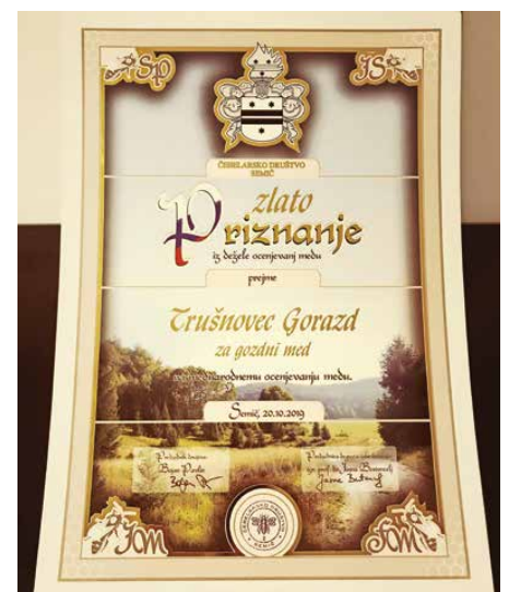
Tudi urbani medovi lahko dosegajo najvišja priznanja.

k ustreznemu vrednotenju. Ker sodelujem s področnimi raziskovalci v več evropskih mestih, tako v tem obdobju razpošljem vzorce medu na vrsto naslovov, z veseljem pa tudi na kakšno ocenjevanje z mednarodno udeležbo. ◆