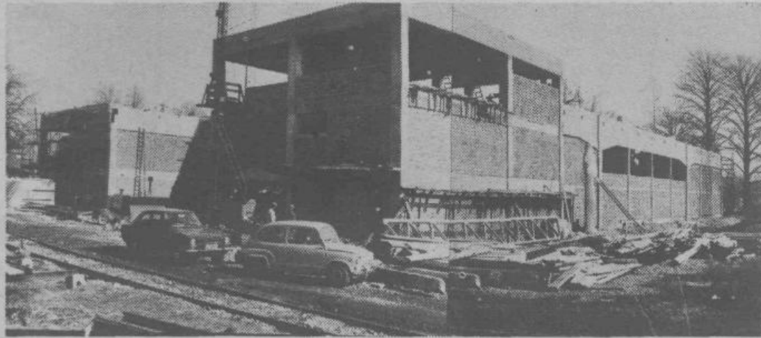
Nov oddelek za izdelavo zidnih tapet v papirnici Vevče je pod streho. Predvidoma bodo v začetku aprila začeli vanj montirati tudi stroje.

Da ne bi bilo v začetku proizvodnje preveč težav z zagonom obrata in začetno proizvodnjo, je tovarna že poslala 5 strokovnjakov k dobavitelju strojev, kjer bodo v 4-mesečni praksi prodrli v srž proizvodnje in organizacije proizvodnje tapet. Te