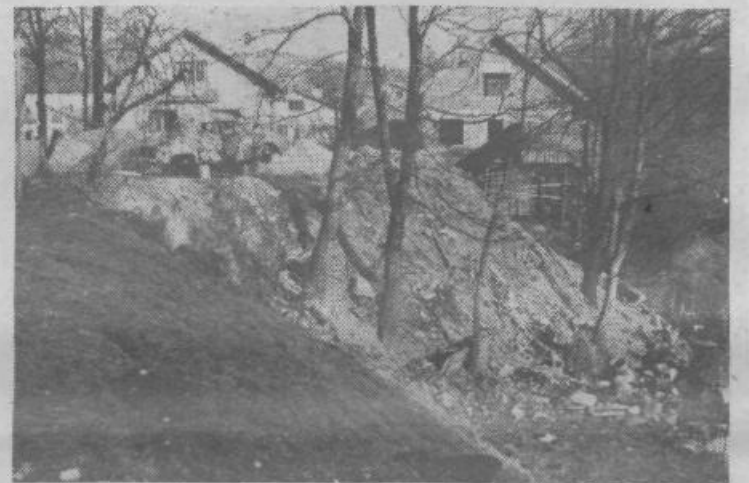
Na „meji“ med Vevčami in Slapami imamo priložnost videti tole divje odlagališče smeti.