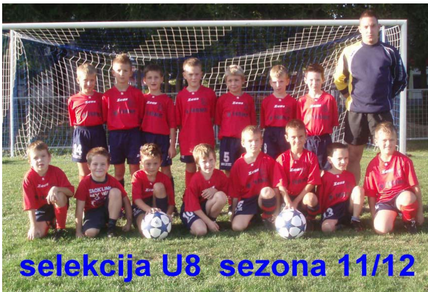
selekcija U8 sezona 11/12

Selekcija U10 je z svojimi uspešnimi nastopi po polovici sezone zasedla odlično 3. mesto in je vsekakor v igri za najboljša mesta. V selekciji U12, mlajši dečki, pa je 1. mesto prepričljivo pripadlo našemu moštvu, ki letos s svojimi nastopi odlično parirajo svojim nasprotnikom in so prav tako kot ekipa U10, resni tekmeč v borbi za najboljša mesta po koncu sezone.