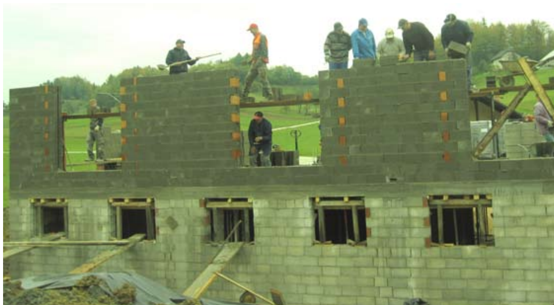
Župan in njegova svetniška skupina so z veseljem prišli zidat