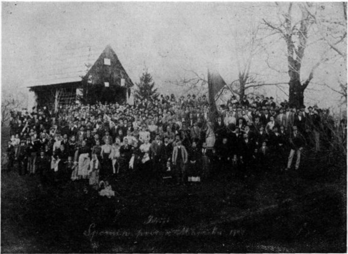
PRAZNOVANJE PRVEGA MAJA LETA 1900 V IDRIJI (Verjetno najstarejša slika na Slovenskem s tega področja)