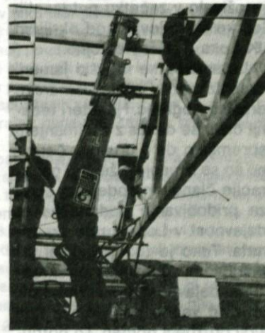
Krstna montaža Gradnikovih nosilcev, nov. 82

Pa tudi zasebni graditelji hlevov ali proizvodnih delavnic bodo imeli v naših izdelkih mikavno oporo.