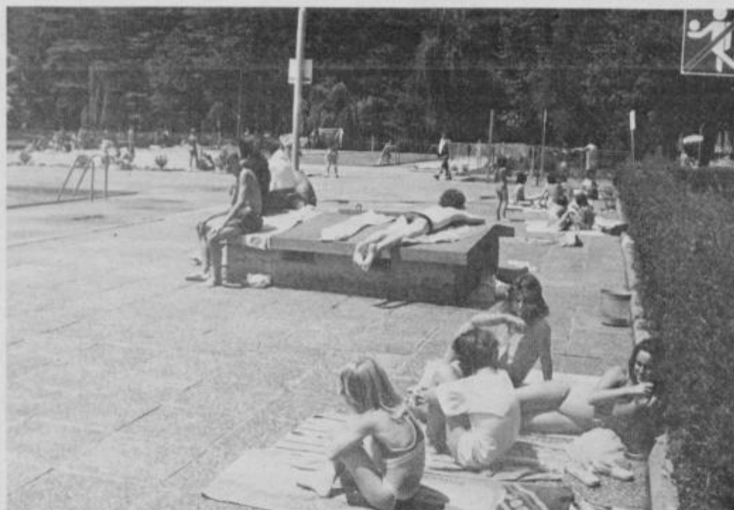
Morje v Kidričevem.