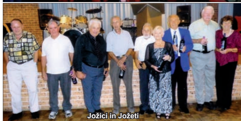
Jožici in Jožeti