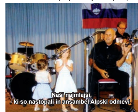
Naši najmlajši, ki so nastopali in ansambel Alpski odmevi