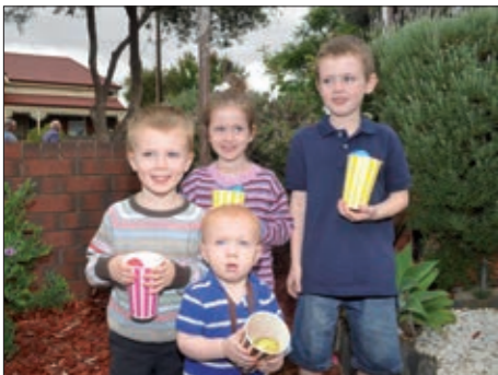
Otroci družine Baxter