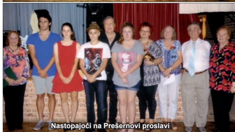
Nastopajoči na Prešernovi proslavi