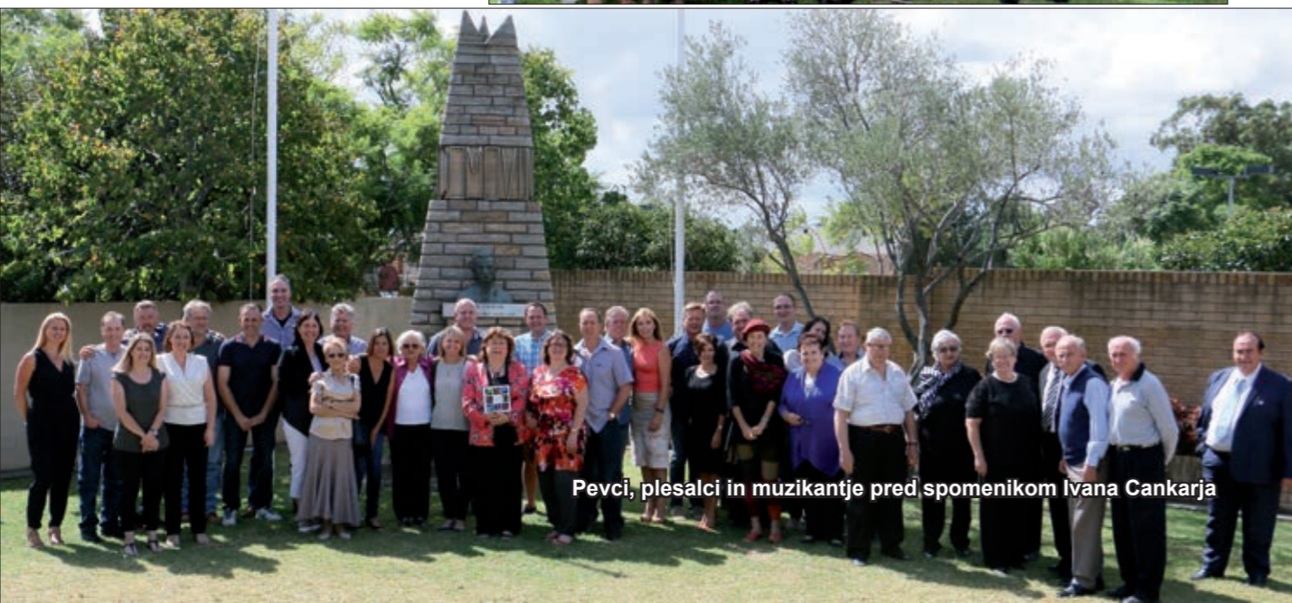
Pevci, plesalci in muzikantje pred spomenikom Ivana Cankarja