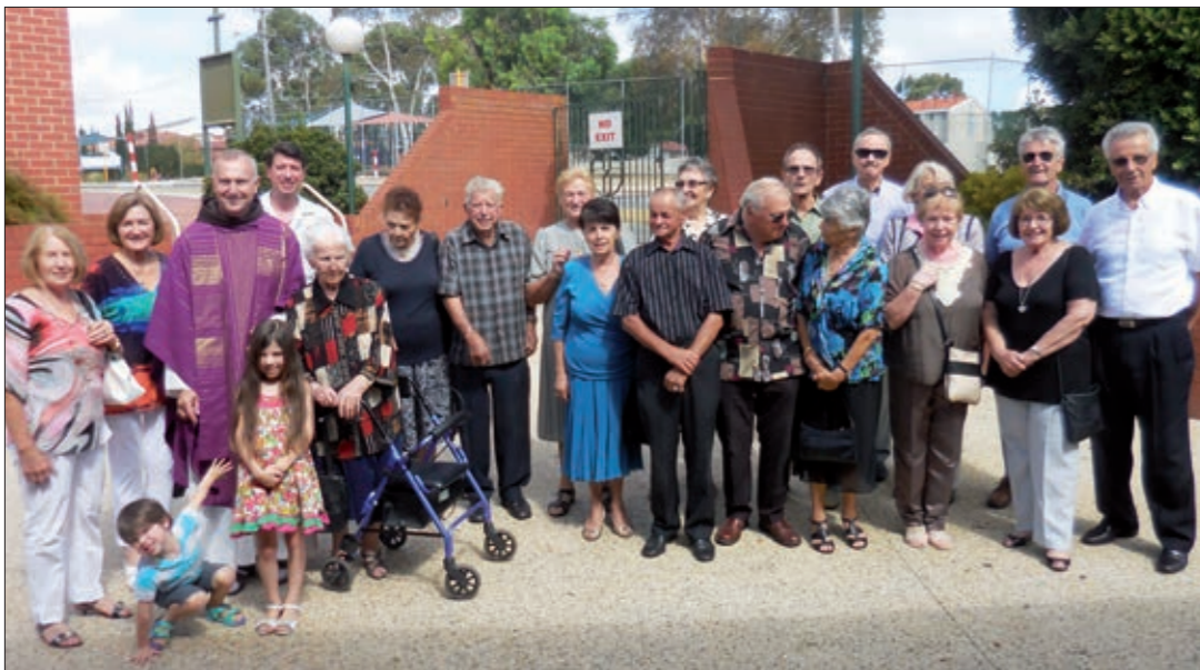
Na drugo postno nedeljo, 21. februarja 2016, smo imeli sveto mašo v cerkvi St. Kieran v Tuart Hill.