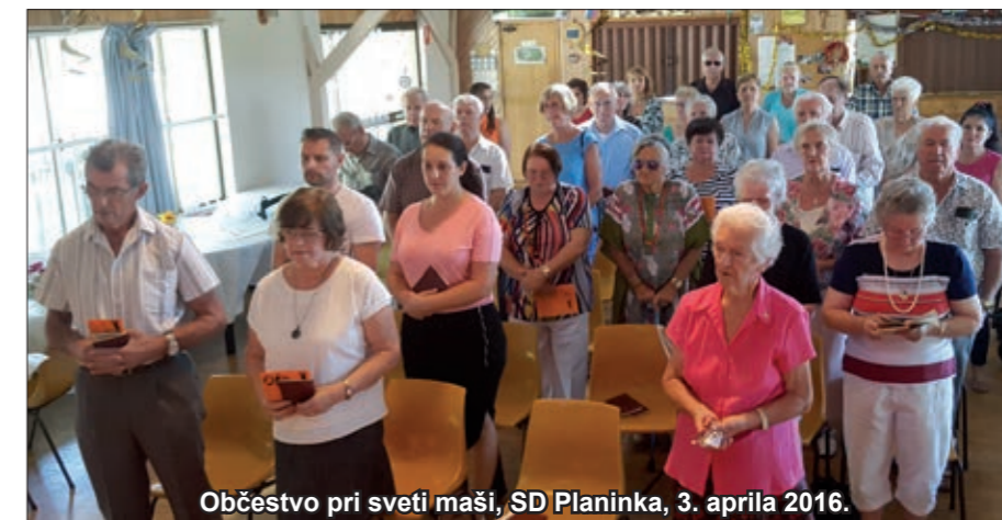
Občestvo pri sveti maši, SD Planinka, 3. aprila 2016.