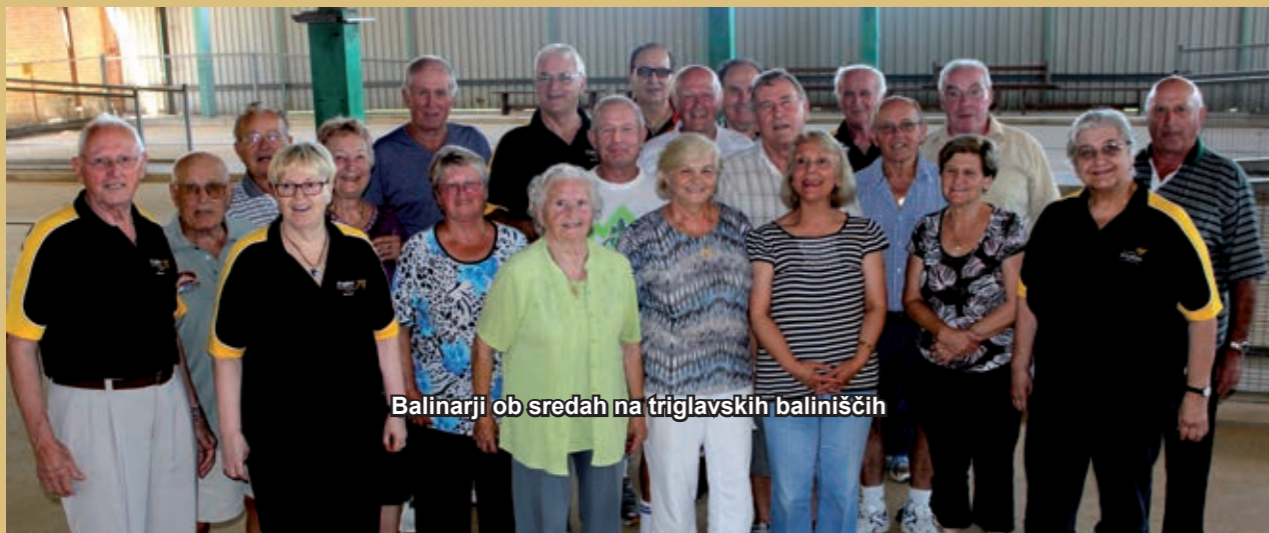
Balinarji ob sredah na triglavskih baliniščih

nekaj vzdihovanja, nismo tekmovalja niti enkrat odpovedali. Proti koncu marca pa se je končno vreme spremenilo in težav z vročino nimamo več. Število tekmovalcev pa se je vseeno zmanjšalo, saj so mnogi balinarji odšli na obisk v domovino ali pa na križarjenje z luksuznimi ladjami na tihomorske otoke, česar si v mladih letih nismo mogli privoščiti. Bog nam daj zdravja, da bomo še dolgo lahko preživljali prijetne popoldneve v prijetni družbi ob tem zanimivem športu!