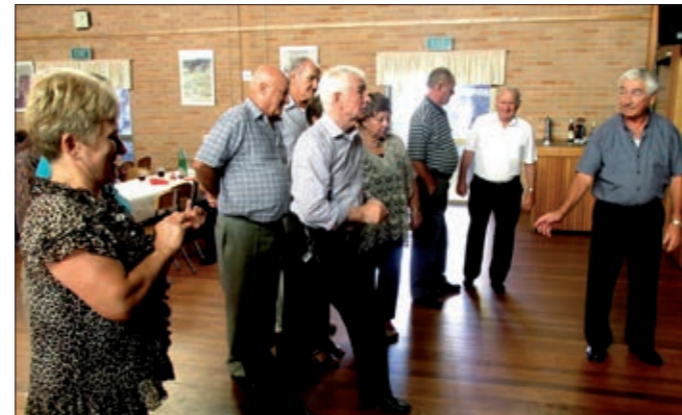
Pridne gospodinje v Merrylandsu.

ne mudi tako domov kot ob večerih. Na veliko soboto , ko prinesemo k blagoslovu, se prav tako ne pozabimo ustaviti pri Jezusu v Božjem grobu. Velikonočna vigilijska sv. maša in procesija v nedeljo zjutraj prav tako. Po sv. maši smo še dolgo ostali pred cerkvijo v prijetnem klepetu in si voščili velikonočne praznike. Opoldne smo praznovali veliko noč v Wollongongu – Figtreeju, zvečer pa v Canberri , kjer se po praznični sv. maši zberemo v cerkveni dvorani ob žegnu in dobrotah, ki so nekatere prave mojstrovine in smo jih imeli res veliko.