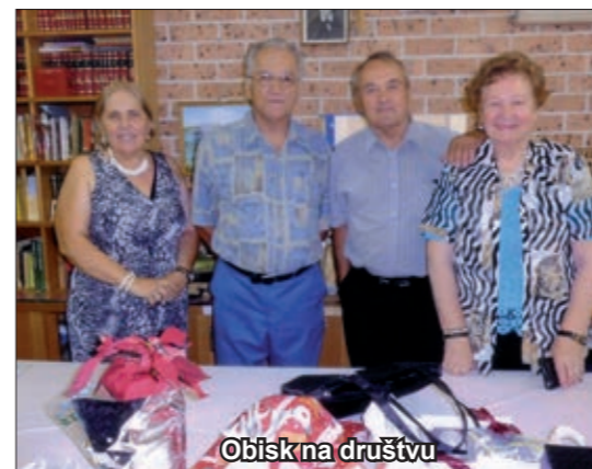
Obisk na društvu