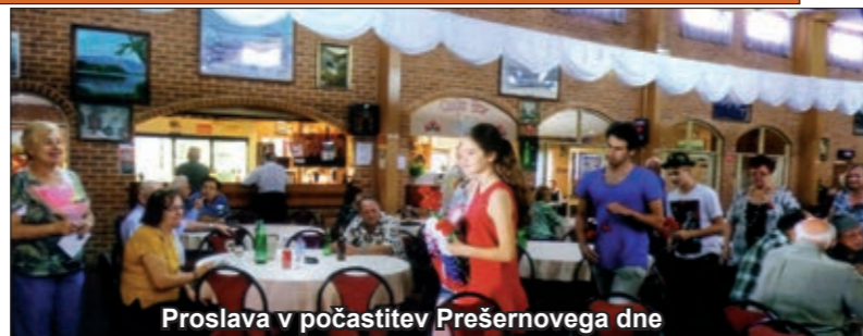
Proslava v počastitev Prešernovega dne

Naslednjo nedeljo, 14. februarja, smo imeli maškarado. Bilo je zelo lepo in zanimivo. Najbolj domiselne in najlepše maske po oceni posebnih sodnikov je