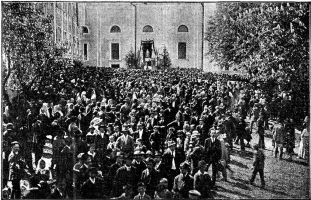
Mladeniški shod pri Sv. Jožefu v Celju.

Kosilo (juha, meso s prikuho in kruh) bo veljalo 13 Din, večerja 10 Din. Kdor želi pečenko s salato, bo doplačal 10 Din. Denar je treba naprej p o s l a t i in sporočiti, za katere dni kdo želi obed (za soboto, nedeljo ali morda tudi ponedeljek) in ako želi samo obed, ali obed in večerjo.