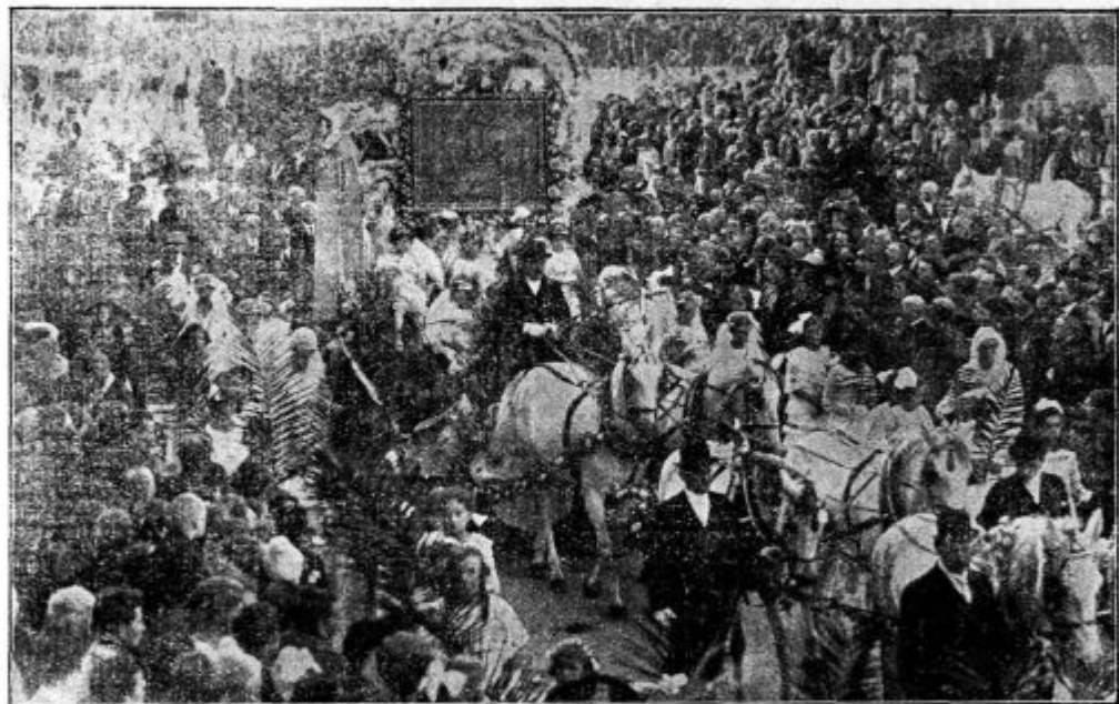
Svetogorsko milostno podobo peljejo na goro.

Če bi o kaki knjižici smeli pričakovati, da bo šla »kakor maslo«, je to pesmarica »Pojte!« Človek bi pričakoval, da je bodo družbe komaj čakale, da jim bo treba samo nakratko naznaniti, pa bodo pograbile po njej, da bo 5000 izvodov v par tednih pokupljenih. In kaj se je zgodilo?! Pomislite: »Venec cerkvenih pesmi«, kate-