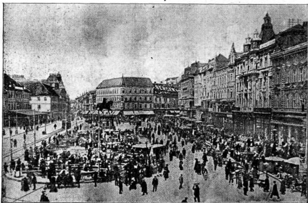
Jelačićev (glavni) trg v Zagrebu.

Vranja peč nad Kamnikom. Upamo, da bo držalo. Saj smo prve brazde potegnili že l. 1921. Nato je škofijski voditelj Mar. družb prerešetal srca materam in dekletom, da postanejo dostopna za družbo. Tudi gg. misijonarja sta o priliki misijona v začetku lanskega leta zastavila svojo besedo v prilog dekliški Marijini družbi. Tako so se dekleta priglašale; vendar smo čas preskušnje potegnili od lanskega novega leta do letošnjega binškošnega