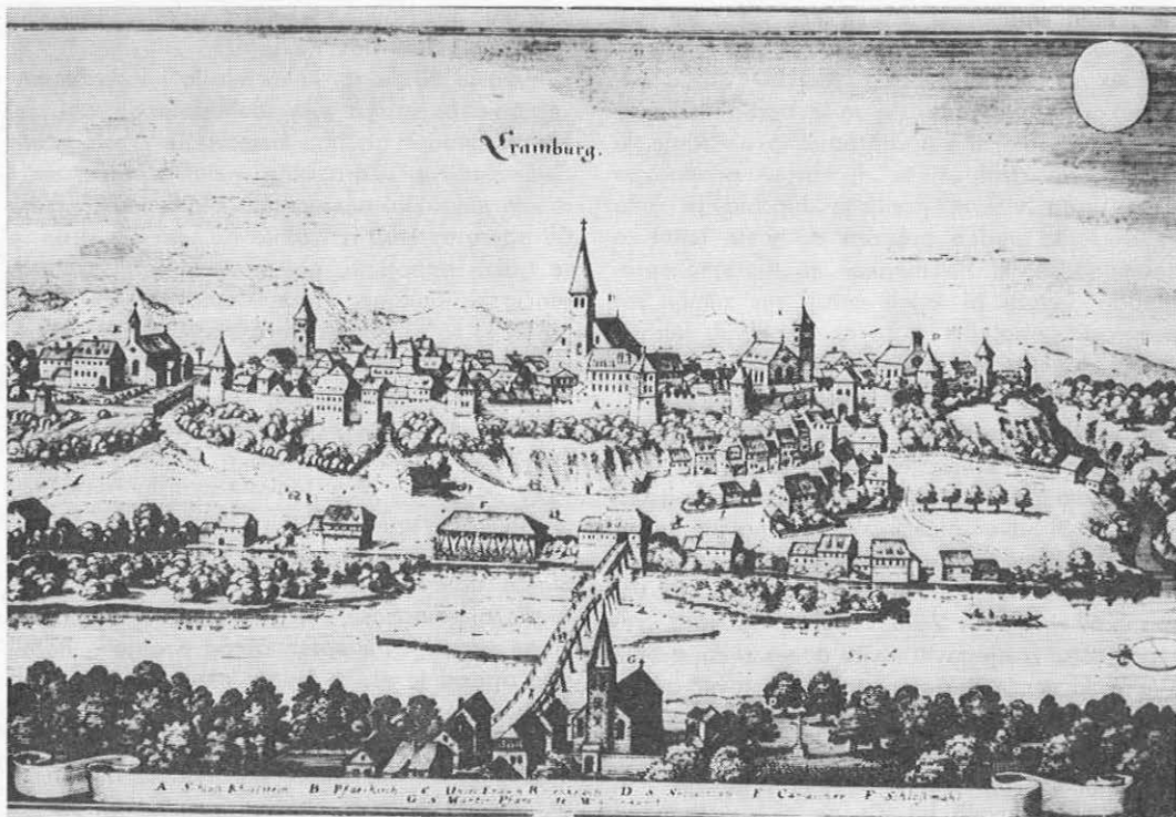
Kranj l. 1649 (M. Merian, Topographia provinciarum Austriacarum... , Frankfurt A. M. 1649)

njegov pomen v kasnejših stoletjih in v rimskem času zaradi preusmeritve važnejših prometnih poti z območja Gorenjske precej oslabi. Medtem ko so nam Iliri poleg grobišča na severozahodnem obrobju mesta zapustili tudi nekatere sledi svoje naselitve v neposredni bližini današnje župne cerkve, t. j. v središčnem, najširšem delu pomola, nam je naselbinska podoba ilirsko-keltske oz. kasnejše rimske naselbine, ki je nosila ime Carnium, mnogo manj jasna. Vendar lahko domnevamo, da se naselbinsko jedro tudi v tem času ni premaknilo s središčnega dela pomola, saj celo njegov za obrambo najbolj pripravi jugovzhodni del, današnji Pungert, ne kaže sledov naseljenosti. Isto velja za podobo Kranja v obdobju preseljevanja narodov, ko v njem bivajo vzhodni Goti, Langobardi in drugi in ki je sicer zastopano z obsežnim grobiščem na jugozahodnem vznožju Pungerta. Čeprav je tudi staroslovanski Kranj večidel prekrit s kasnejšim srednjeveškim naseljem, nam vendar to pot rezultati arheoloških izkopavanj dovolj jasno dokazujejo, da se je slovansko naselbinsko jedro razvrščalo okrog pred leti odkritega grobišča na področju da-