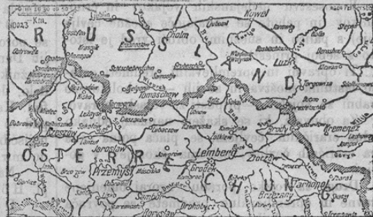
Karte zuden Schlächtern in Süd-Polen.