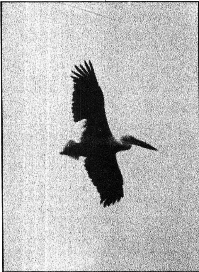
Slika 1: Rožnati pelikan Pelecanus onocrotalus nad Medvedcami dne 29.04.1995

Photo 1: White Pelican Pelecanus onocrotalus at Dravsko polje on 29 th April 1995