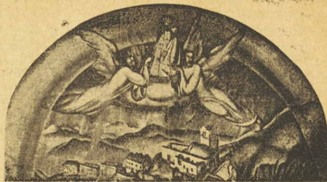
Un cuadro de las pinturas del Santuario de Višarje. Los ángeles llevan a Ntra. Señora al lugar elegido por Ella. Angeli neso Marijo iz Žabnice na Sv. Višarje.

El precepto de amor sobrepasa el cuadro de la familia y se extiende hasta el prójimo, pues a todos