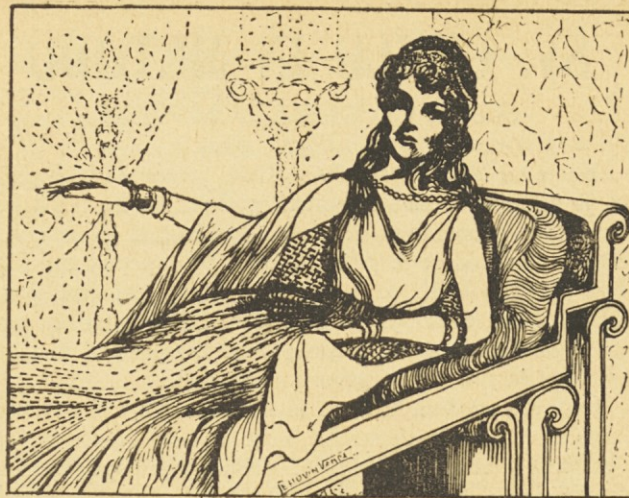
Alanca, celosa de Liubíniza . . .

Todo el grupo siguió la huella que se internaba en el bosque, donde las ramas quebradas mostraron el camino seguido por Liubíniza. Ninguna huella escapaba a los habitantes nómades de la llanura libre. Apostaban entre ellos quién la encontraría el primero. Todos ansiaban recibir del brujo la mayor prosperidad para su ganado. Radován iba con precaución tras ellos, pronunciando de vez en cuando una palabra discreta, felicitando a todo aquel que encontrara una huella y prediciendo una riqueza inmensa en el ganado.