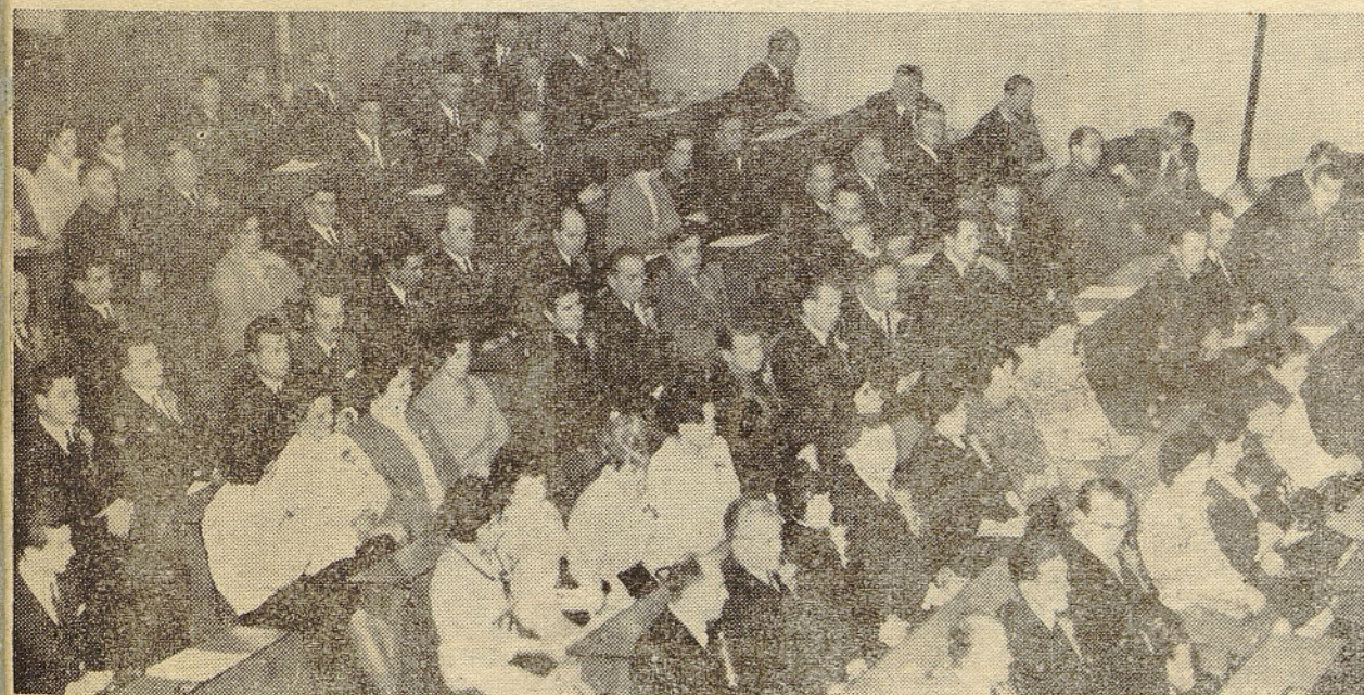
Pogled v dvorano kranjske občinske skupščine, kjer so se zbrali jubilarji 20-letnega dela v Iskri in člani DS »Elektromehanika«