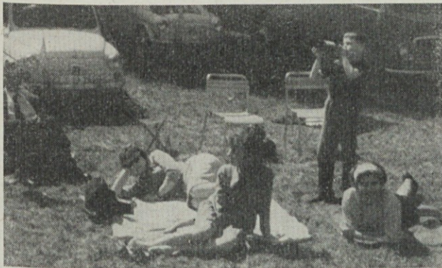
To je bil namen piknika 19. aprila ob Cerkniškem jezeru. Udeleženci so se sprostili ter uživali zrak in sonce brez običajne etike. Brez izjeme vsi so bili zadovoljni

Pripravljalni odbor za izvedbo letošnjega tekmovanja je bil postavljen od strelske družine in sindikalne podružnice v Induplati. Pripravljalna dela so trajala 2 meseca, intenzivno pa se je delalo zadnjih sedem dni. Pripominjamo, da so bila vsa dosedanja