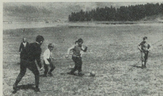
»Gužva pred golom« rekreacijska dejavnost mlajših udeležencev piknika 19. aprila 1964