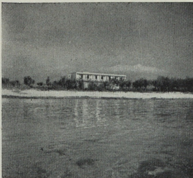
Naš dom v Umagu. Pogled z morja

Sama zamisel upravičuje vse pomanjkljivosti, ki so se še pojavile pri izdelavi filma, med katere prištevamo kot važno pomanjkljivo svetlobo. Ostale pripombe so pozitivne in je nadaljevanje takšnega dela samo zaželeno, ker bomo, kot je to nekdo naglasil, ta film lahko uporabili kot vizuelno sredstvo pri uvajanju nove delovne sile v podjetju, kot dokument pri polaganju obračuna za naše delo in pri različnih sprejemih in pogostitvah, ki so že v tradiciji.