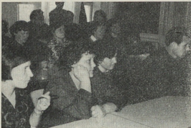
Člani OO ZK Induplati na konferenci

Gostje iz Ljubljane in Domžal na konferenci. Nejasni termini. Samo 53 % članov je zaposlenih v direktni proizvodnji