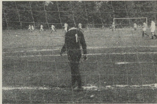
Z nogometne tekme Jarše : Vrhnika (Usnjar). Tekma je bila zaradi vdora gledalcev na igrišče v 79 minuti prekinjena pri stanju 2 : 1 za Jarše