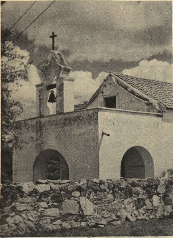
Cerkvica v Dolforesu in kip žalostne Matere božje