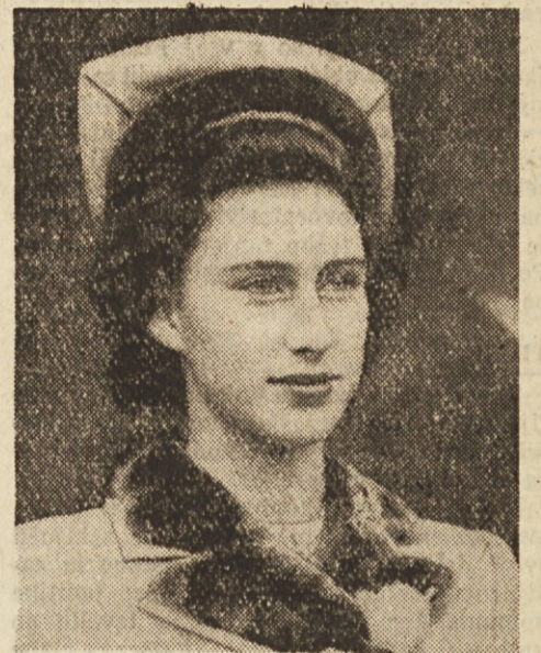
Angleška princezinja Margareta Rose je 21. avgusta obhajala osemnajsti rojstni dan

Kdaj se bodo pričeli naslednji pogovori v Moskvi odvisi od tega, kdaj bodo dobili zas- topniki zapadnih velesil nova navodila.