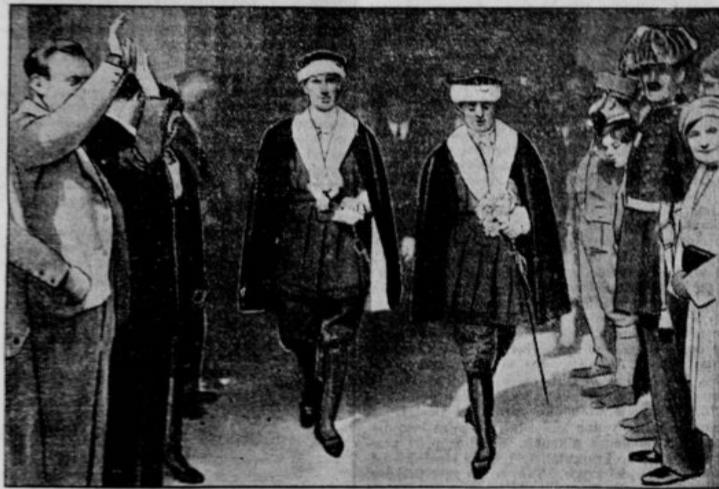
Novi »Caoitani Reggenti« republike San Marino po izvolitvi. Ljudstvo jih pozdravlja s fašistovskim pozdravom. San Marino šteje 13.000 prebivalcev in je ena najmanjših držav na svetu. Stoji pod protektoratom Italije. Mala državnica ima kljub temu nad 1000 možno močno armado.

Delovala je potem celo svetovno vojno in s svojimi vohunskimi podjetji silno koristila nemški armadi. Kmalu je postala znana in Francija je spoznala v njej tako nevarno vohunko, da je razpisala na njeno glavo pol milijona frankov. Toda na noben način je niso mogli dobiti v roke. Dvoje njenih podjetij smo že v začetku omenili, omenimo še eno, kjer je res v polni meri dokazala svojo sposobnost za vohunstvo. Leta 1917 je nemški ge-