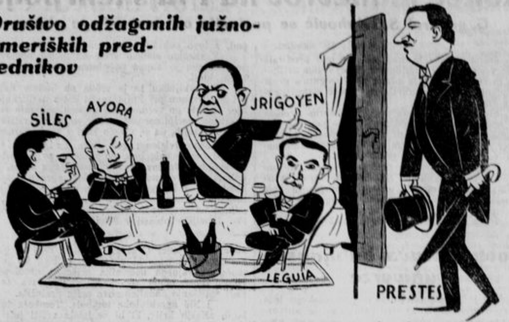
Južnoameriški predsedniki n. r. zborujejo v gostilni pri »Veslem štrbunku«. Južnoameriške države Argentina, Peru, Ecuador in Bolivija so zaporedoma po več ali manj krvavih bojih poslale svoje predsednike v »pokoje«. Sedaj je na vrsti dr. Prestes v Braziliji. — Irigoyen: »Gospodjel Nov član se je prijavil.«

rano pobegnila čez mejo. Kmalu za tem se je lotila novega podjetja kot ameriška bolničarka, kar smo opisali že v uvodu. To je bilo tudi njeno zadnje podjetje. Takoj po končani vojni so ji odpovedali živci in svoje zadnje dni preživlja med zidovi norišnice v Švici.