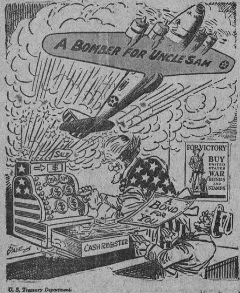
U. S. Treasury Department.