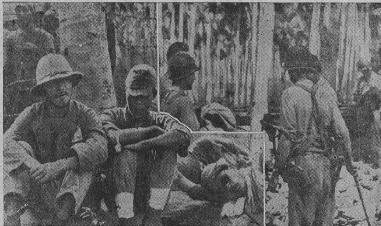
Na sliki vidimo nekaj Japoncev, ki so jih ujeli ameriški marini na Solomonih. Na desni pregledujejo marini zaplenjeno bojno opremo.

oči so se ji pričele svetiti z bolnim bleskom, glava je postala še večja, a život manjši in slabotnejši. A v njeni duši je živel kakor preje nekaj nemirnega, brezpokojnega, kar jo je žgalo z zavestjo lastne brezpomembnosti, neodoljivi sililo, da poišče nekaj velikega, lepega, silnega. V enem letu jo je gonila ta nemirna sila po celi Rusiji, skozi tisoč nevarnosti, in jo prignala slednjič v to pusto zlovoščje stanovanje, v katerem se je započela in razširila obširna teroristična zarota.