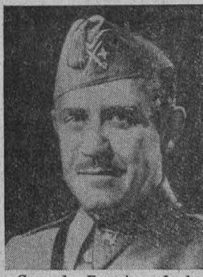
Generala Francisco Jordana je imenoval general Franco za novega zunanjega ministra Španije, katero listnico je imel prej Francov svak Raymond Serrano Suner.