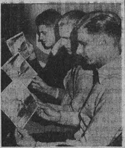
Trije Nary bratje iz Wilingtona, Mass., so pričeli s kampanjo "Mi smo Lexington bratje," da se nabere denar za novo ladjo Lexington. Na sliki jih je vi- deti, ko gledajo slike, ki kažejo, kako se pogreza stara matična ladja Lexington.

venskem društvenem domu na Recher Ave. 26. decembra, sobota. — Društvo "Spartans" S. N. P. J. — Plesna prireditev v avditoriju Slovenskega narodnega doma na St. Clair Ave. 27. decembra, nedelja. — American Jugoslav Veterans — prireditev v avditoriju Slo- venskega narodnega doma, na St. Clair Ave. 31. decembra, četrtek. — Silve- strov večer Slovenskega na- rodnega doma in Kluba dru- štev Slovenskega narodnega doma v obeh dvoranah Slo- venskega narodnega doma, na St. Clair Avenue.