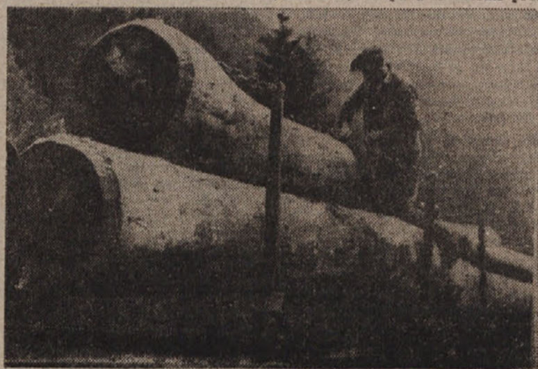
OGROMNA ZDRAVA DEBLA ODVAŽAJO IZ GOZDOV NA ŽAGE

Iz navedenega vidimo, da je slovensko lesno gospodarstvo postavljeno na nove teme je. Ustanovljeno je pravilno gojenje in smotno izkoriščanje gozdnega bogastva, tako da bo brez škode za celotno lesno bogatstvo dovolj lesa za vse potrebe rudnikov, stavbne industrije, za kurjavo, zlasti pa za razvijajočo se lesno-prede'ovalno industrijo, ki ima zlasti v Sloveniji veliko bodočnost.