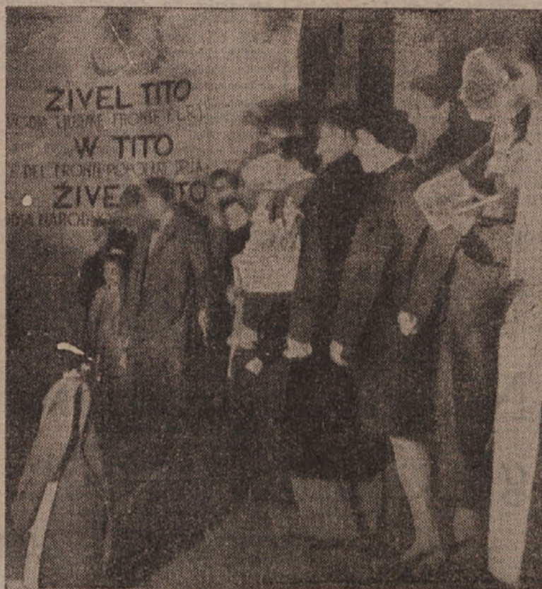
DELEGACIJA ZA DELEGACIJO IZ MESTNIH OKRAJEV IN TOVARN TER IZ PODEŽELJA JE PRINAŠALA NA KONGRES DARILA.

Fašizem je bil nad vse tipična manifestacija ne le političnega, gospodarskega in socialnega zatiranja velikih delavskih množic, marveč tudi kulturnega in moralnega nasilja, s katerim se je uveljavilo najodločnejše in najnapadnejše sovražstvo nasproti drugim plastem, ki so gojile progresivne ali kakorkoli iskreno liberalne ideje. Bilo je jasno, da se bodo načela zločinske napačnosti razčistila z notranje političnega na zunanje politično področje, da bi se tako izžvele nenasitna kolonialna grabelžljivost kapitalističnih razredov, s čimer pa je bil že podan dokaz, da pomeni fašizem vojno in narodno zatiranje. Tako imenovane zapadne demokracije so hotele doseči pomirjenje fašističnih diktatorjev s tem, da so dopustile poraz Ljudske fronte v Spaniji, okupacijo Avstrije, aneksijo Sudetov, pohod na Prago in ostalo Češkoslovaško in okupacijo Albanije. Politika popuščanja je dovedla do svetovne vojne.