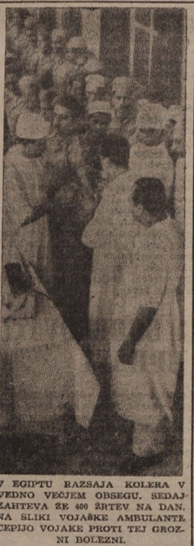
V EGIPTU RAZSAJA KOLERA V VEDNO VEČJEM OBSEGU. SEDAJ ZAHTEVA ŽE 400 ŽRTEV NA DAN. NA SLIKI VOJAŠKE AMBULANTE ČEPIJO VOJAKE PROTI TEJ GROZNI BOLEZNI.

čih živali: na krajih rojstva bodo postavili lovišča.