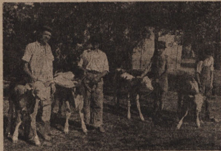
VOJNA JE V MNOGIH PREDELIH JUGOSLAVIJE ZELO PRIZADELA ŽIVINOREJO. DRŽAVI IN ŠTEVILNIM ŽIVINOREJSKIM ŠOLAM IN ZADRUŽAM JE V KRATKEM ČASU USPELO V PRECEJNJI MERI IZLEČITI RANE V TEJ PANOGI NARODNEGA GOSPODARSTVA. NA SLIKI TELAČKI NEKE ŠVICARSE PASME.

Prav tako morajo posamezni kmetovalci in krajevni odbori že sedaj javiti kmetijskemu odseku okrajnega odbora kaj vse bodo potrebovali spomladati, kajti od pravočasnega poročanja kaj vse pride v poštev za spomladansko setev, zavisi v veliki meri prihodnja žetev.