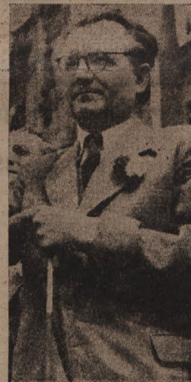
DR. KLEMENT GOTTWALD, PREDSEDNIK VLADE ČESKOSLOVAŠKE REPUBLIKE IN SEKRETAR KOMUNISTIČNE PARTIJE V CSR.

Borba, ki se nam obeta, bo trda, toda izvršni odbor upravičeno pričakuje, da bo vsak član SIAU-ja znal izvršiti svojo nalogo in zahteva od vsakega od njih disciplino, zvestobo, borbennost in požrtvovalnost kar je vse bilo osnova dosedanjih velikih uspehov in kar jamči tudi za uspešno nadaljnje delo.