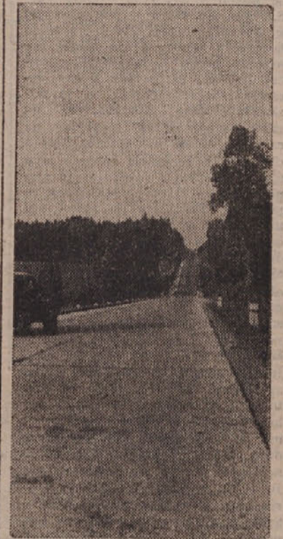
LJUDSKE OBLASTI V JUGOSLAVIJI POSVEČAJO VELIKO SKRBE IZGRADNJI DOBREGA CESTNEGA OMREŽJA. NAJVEČJE DELO TE VRSTE JE V JUGOSLAVIJI TRENUTNO AVTOMOBILSKA CESTA TRST-ZAGREB -BEOGRAD. NA SLIKI BETONSKA CESTA PROTI KRANJU

Vzporedno s tem se bo razvijala, oz. celo na novo osnovala industrija za predelavo raznih gozdnih pridelkov. Pri tem je najvažnejše pridobivanje smole v borovih gozdovih in nje predelovanje. Pred vojno smolarjenja po naših gozdovih skoro sploh ni bilo in šele lani so se pričeli prvi poskusi, ki so dali lepe rezultate. Letos je delo že močno napredovalo in pridobljene so