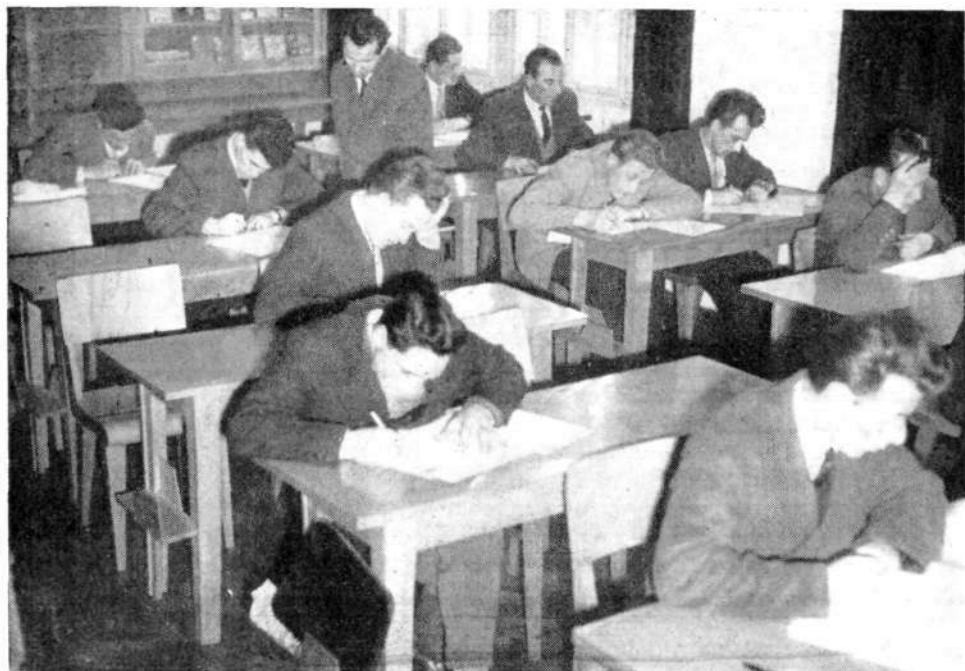
Matematična naloga pri izobraževanju odraslih v Solskem centru

obe stroki in izdelani učni načrti. Vse to pa ni več dopuščalo, da bi v istem oddelku sedela kovinar in mizar.