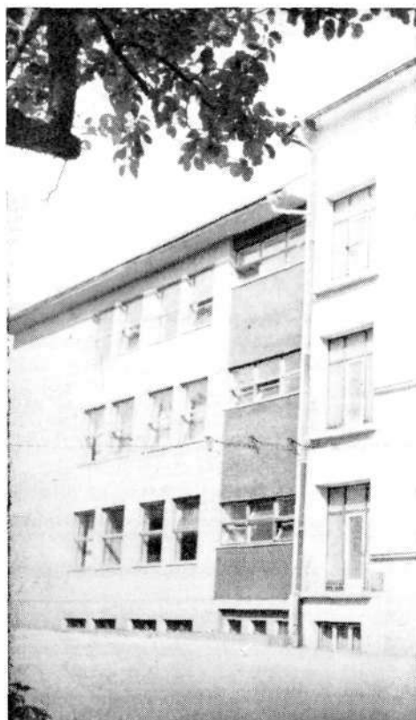
Trakt poklicne šole, sezidan i. 1960 kot prizidek k poslopju osnovne šole

pokorščino in pridnost. V prvih letih učne dobe je moral opravljati razna pomožna dela, ki s poklicem niso imela zveze. Vsak vajenec pa se je želel čimprej otresti naziva »ta mal«. Šele, ko ga je zamenjal mlajši vajenec, mu je mojster zaupal pomembnejša dela v sami delavnici. Tudi predaprilska Jugoslavija ni napravila pri vzgoji delavskega naraščaja bistvenega napredka. Glavni poudarek šolanja je bil na splošno izobraževalnih predmetih. V istem razredu so bili vajenci najrazličnejših poklicev. Na šolah so poučevali le honorarni učitelji, ki so posredovali učencem le učno snov, za vzgojno rast mladine pa se niso zanimali. Tudi oblast se ni zanimala za vajence, zato so bili še vedno predmet izkoriščanja in preziranja.