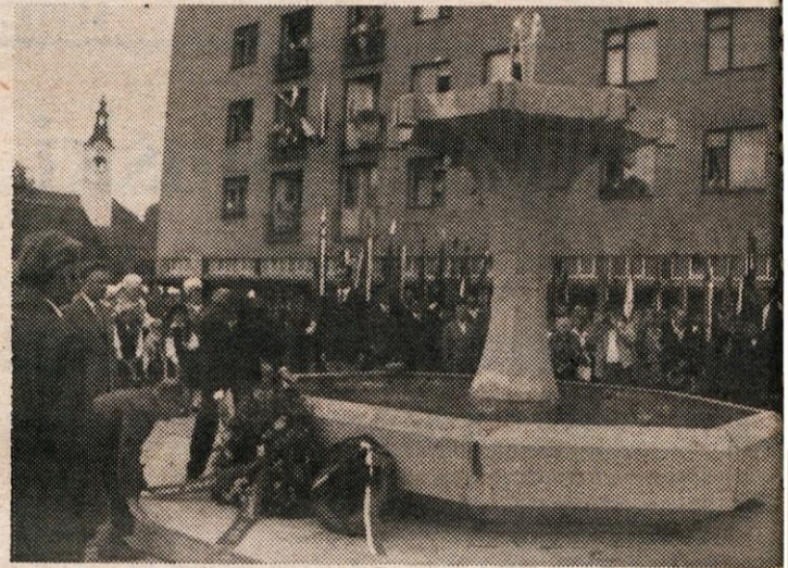
SPOMENIK TALCEM PO ODKRITJU