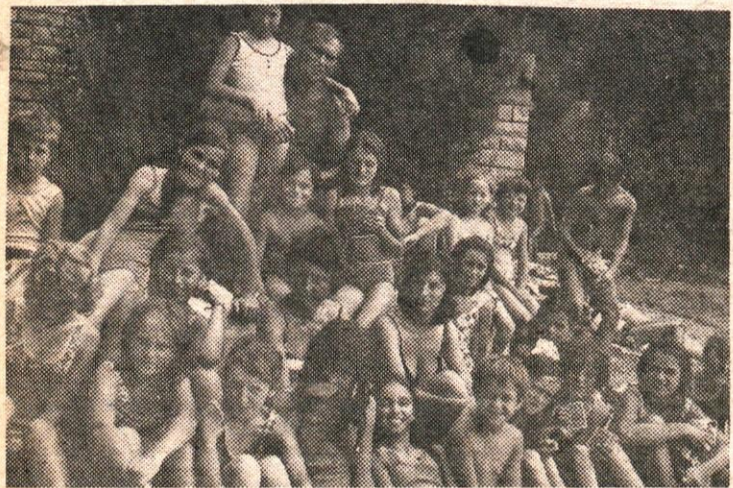
VESELJE NA DEBELEM RTIČU: DRUGA SKUPINA KAMNIŠKIH OTROK

V mesecu juliju letos je na Debelem rtiču pri Ankaranu letovalo 120 šolskih otrok iz naše občine. V vsaki izmeni, ki je trajala po 14 dni je bilo po 60 otrok. Čeprav je občinska zveza prijatelj mladine kot organizator letovanja letos zagotovila več mest v mladinskemu okrevališču, je kljub temu število prijavljenih otrok presego rezervirane zmogljivosti za kamniško kolonijo. Starši so prispevali k stroškom letovanja po 150 do 400 dinarjev na otroka, glede na družinski dohodek. V koloniji pa so bili zastopani otroci z