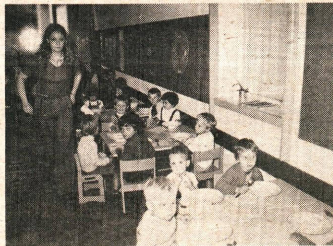
NOVA JEDILNICA V KAMNIŠKEM OTROŠKEM VRTCU

Čeprav je bilo treba na uresničitev načrta o razširitvi ustanove precej časa čakati (sklad za otroško varstvo je začel