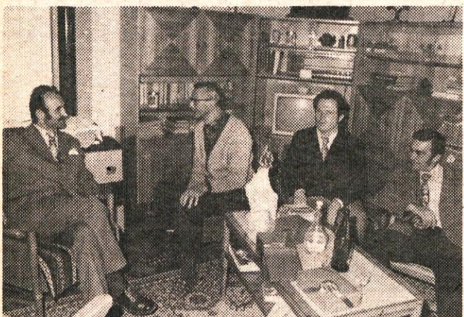
PREDSTAVNIKI OBČINE SO ČESTITALI JUBILANTU

Slavljenca so te dni obiskali in mu čestitali k visokemu jubileju predsednik