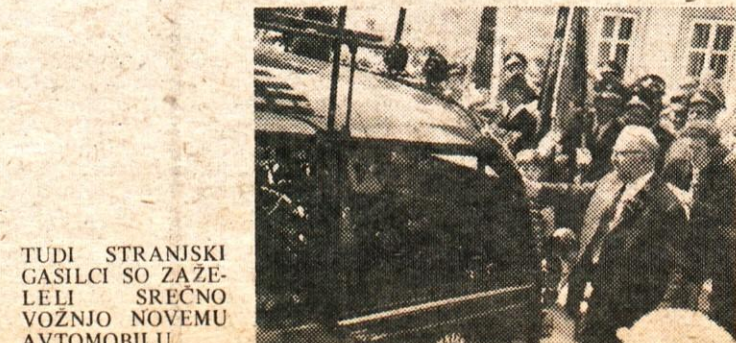
TUDI STRANJSKI GASILCI SO ZAZELELI SREČNO VOZNO NOVEMU AVTOMOBILU