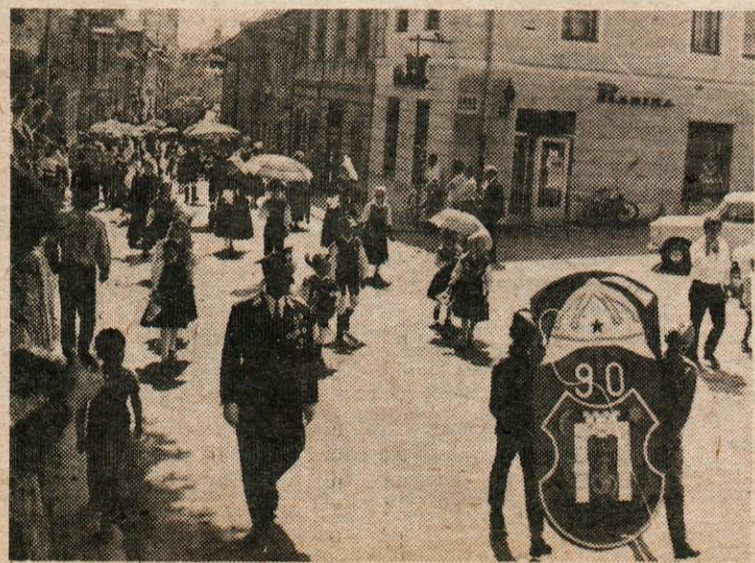
SPREVOD GASILCEV IN NARODNIH NOŠ OB 90-LETNICI KAMNIŠKEGA GASILSTVA