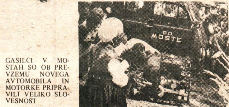
GASILCI V MOSTAH SO OB PREVZEMU NOVEGA AVTOMOBILA IN MOTORKE PRIPRAVILI VELIKO SLOVESNOST