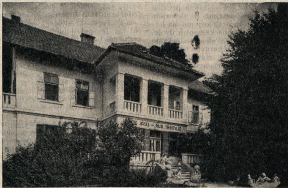
Ene izmed številnih otroških jasli v Jugoslaviji

In žene, matere delajo. Delajo na vseh nešteti deloviščih domovine, ki postaja lepša, naprednejša. V tovarnah, na stavbiščih, delavnicah, institutih, — pri delih, ki so še nedavno veljali izključno za moške, povsod se žene danes uveljavljajo.