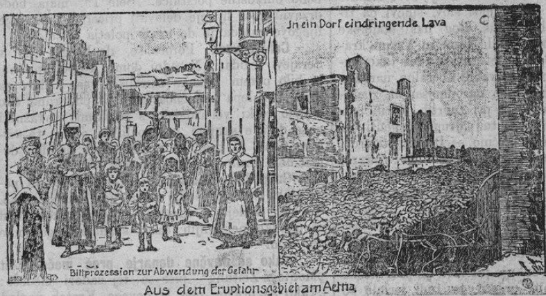
AUS dem Eruptionsgebiet am Atna

Naša slika kaže na levi strani prisolno procesijo, ki so jo prestrašeni kmetje priredili, da jim božja milost grozečo nevarnost odstrani. Na desni strani pa vidimo, kako teče lava v vas in uniči