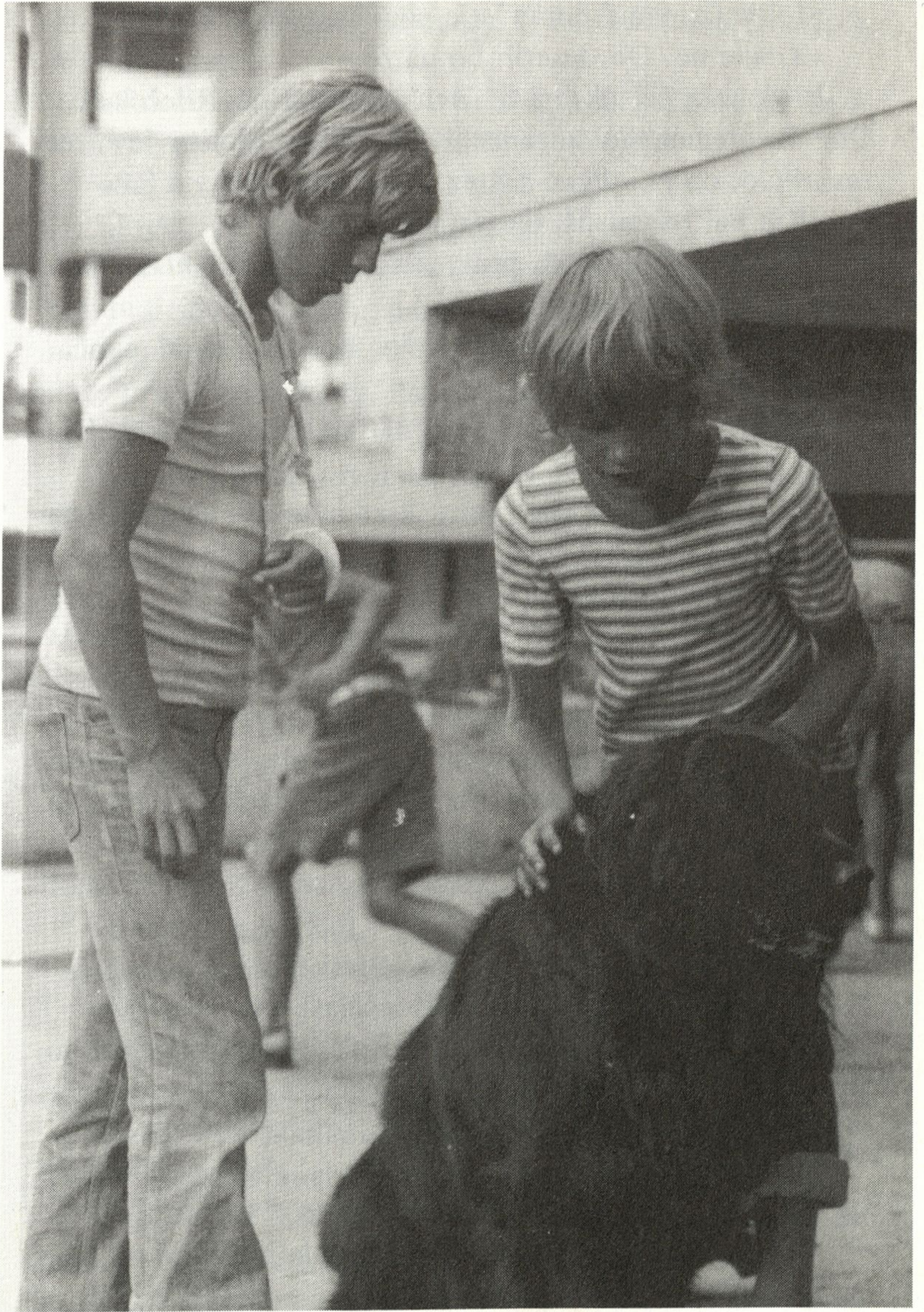
Two boys in a hallway, one looking at the other who is looking at a dark object on the floor.