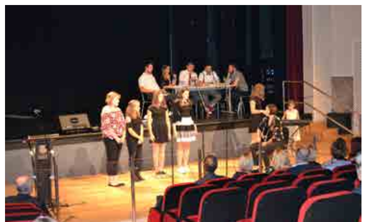
Utrinek s proslave ob dnevu državnosti