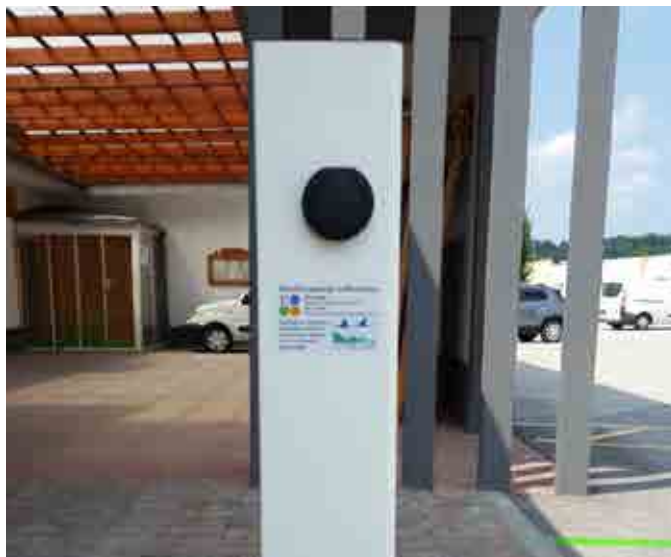
Polnilnica za električna vozila na Bregu