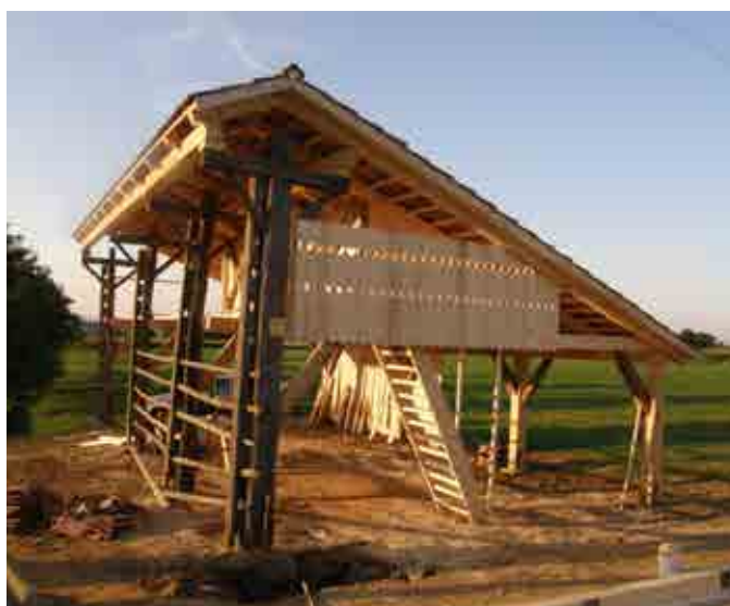
Obnovljeni kozolec v Sestržah