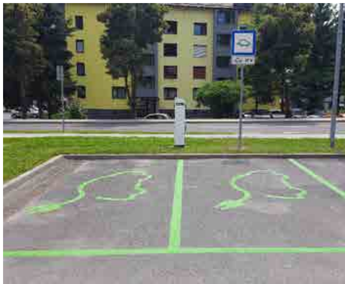
Polnilnica za električna vozila v Majšperku