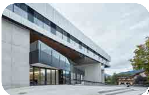
Izvedeni projekti podjetja v preteklosti