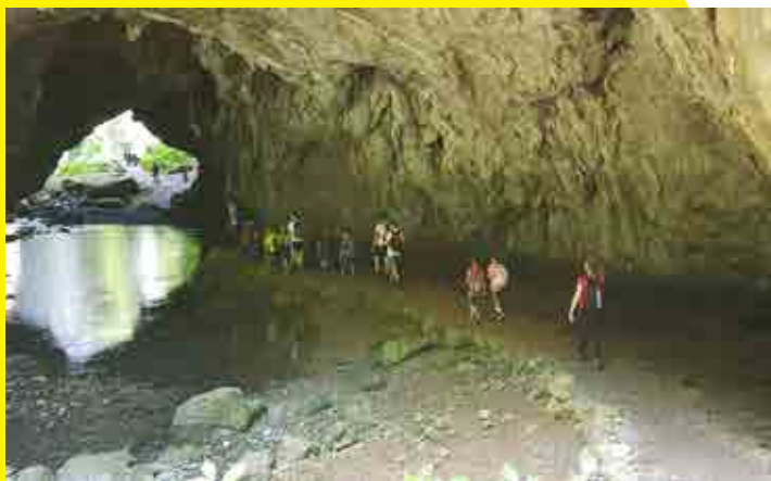
Udeleženci planinskega tabora PD Stoperce so odkrivali Rakov Škocjan