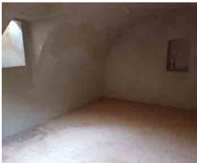
Vinoteka in obnova TIC-a na Ptujski Gori