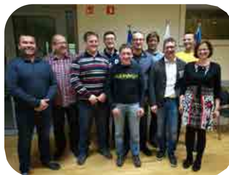
Zaposleni v podjetju W-metalTech