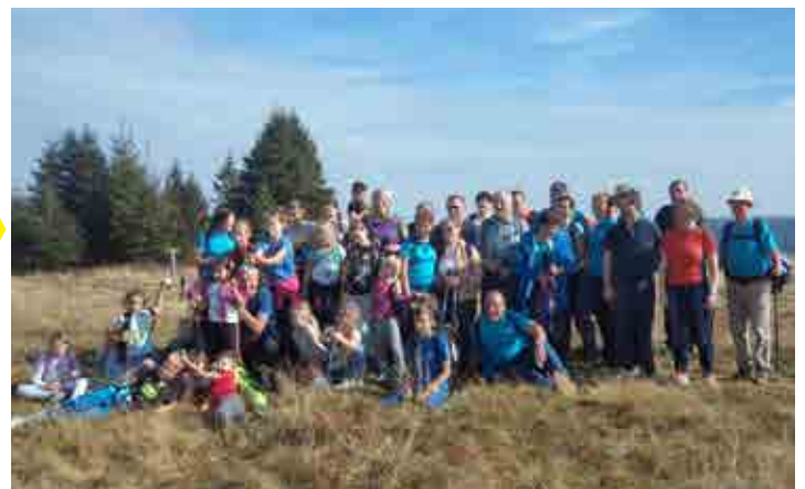
Projekt Zdrav življenjski slog: osnovnošolci in PD Majšperk na Kopah