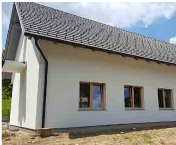
Večnamenski objekt v Narapljah