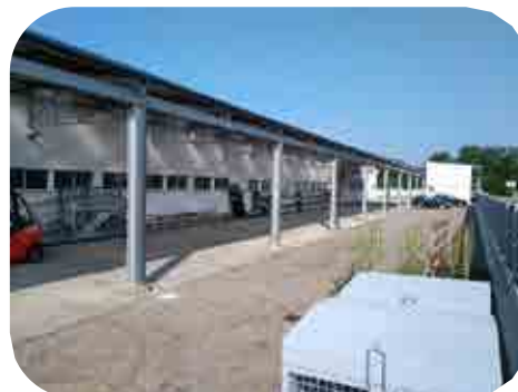
Prostori v Majšperku