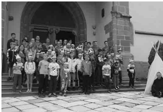
Ena indijanska za zaključek