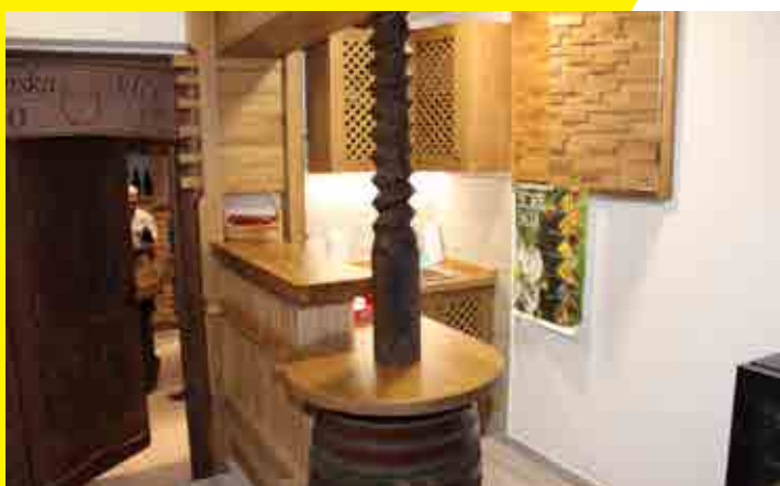
Društvo vinogradnikov in sadjarjev Majšperk je dobilo svojo klet