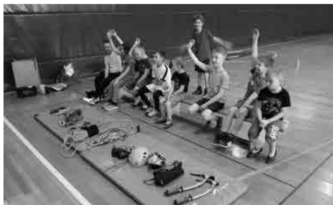
Spoznavanje plezalnih pripomočkov