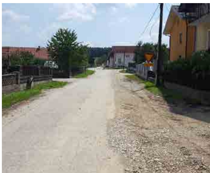
Kanalizacija v Sestržah