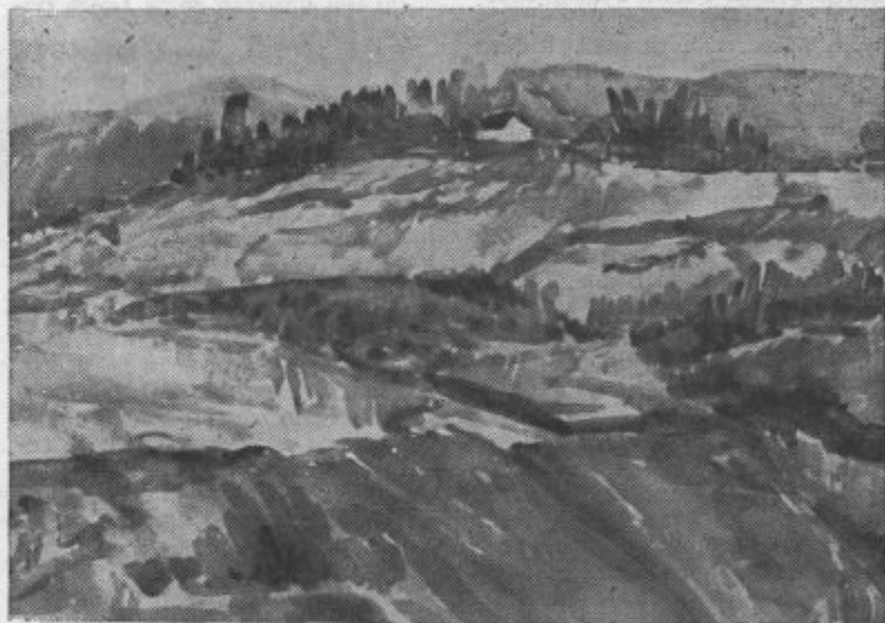
Akademski slikar Lojze Zavolovšek: Nad velenjskim rudnikom (akvarel)