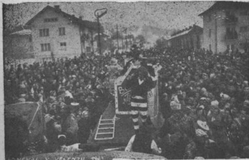
Kaj, skoraj neverjetno, koliko radovednežev?!