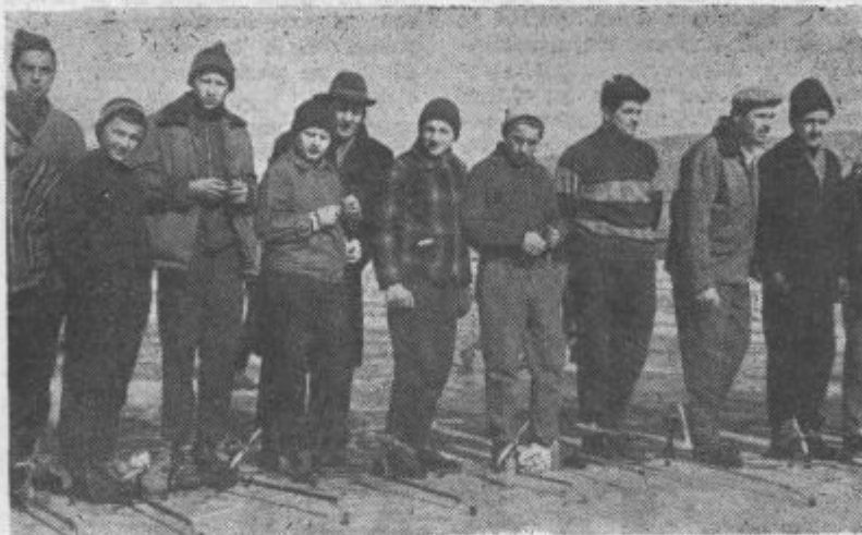
Naši modelarji s svojimi ledodrsniki

Modelarsko društvo Ljudske tehnike Velenje