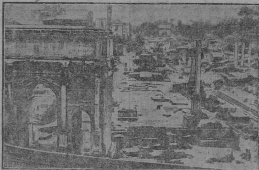
Rim pod snežno odejo, kar je redka prikazen. Na sliki vidimo zasneženi rimski trg iz dobe cesarjev.