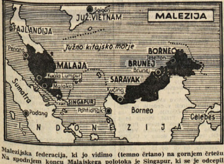
Malezijska federacija, ki jo vidimo (temno črtano) na gornjem črtu. Na spodnjem koncu Malaškega polotoka je Singapur, ki se je ocepil.

Bila je preprosta, skoro nenadana kmečka žena, toda njena narodna zavest je bila močna, prav tako navezanost na zemljo. Ko so jeseni leta 1918 Italijani brez boja zasedli Primorsko in tudi Cerkljansko, jim tega ni nikoli odpustila. Ob vsaki priložnosti si jih je privoščila in jim vedno zasolila kakšno pikro besedo, na račun njihove toliko opevane «zmage». Naša Idrijska... Leta 1929 sem bil kot takratni italijanski državljani - po narodnosti in rojstvu še vedno Slovenec - poklican na odsluženje vojaškega roka v Rim. Bil sem dodeljen 8. polku sapperjev in minirjev, ki je imel svoj sedež v Nomentanski ulici. Skupina Slovencev z Gorlškega smo se nekoč fotografirali, da se gremo slikati k fotografu De Micheliju v Ulico Fabio Massimo. Medtem ko smo čakali na vrsto, smo se med seboj pogovarjali v slovenskem. V ateljeju je čakal tudi starejši Rimljan. Po znanosti je izgledal kot potomce starih plemenitih družin. Pozorno je poslušal naš razgovor in nazadnje vprašal: od kod smo doma in kakšen jezik govorimo. Ko je zvedel, da smo Slovenci z Gorlškega, je dejal: «Voi siete stati aggregati all'Italia per disgrazia nostra e vostra.» (Vi ste bili priključeni Italiji v našo in svojo nesrečo).