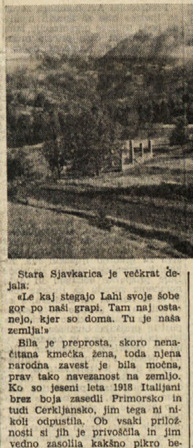
Stara Sjavkarica je večkrat dejala: «Kaj stegajo Lah! svoje šobe gor po naši grapi. Tam naj ostanejo, kjer so doma. Tu je naša zemlja!»

koncem planote, kjer stoji cerkev sv. Ivana, ter Kojco in Rodnami na drugi strani, je široka in globoka Idrijska dolina, po kateri teče reka Idrijska. Iz doline je bilo slišati tisto jutro zamolklo brumenje narasle Idrije in pritoka Čutrovice. Naša Idrijska... Kolikokrat smo se kot otroci poslušali to hrumenje in bomenje. Po vsakem večjem nalu smo leteli na razgledno točko na koncu planote in obudovali moč narasle Idrije, siki je šla čez vse prodovalce, zalila travnik pod Konsumom in Rinkovo njivo v Logu pod Polikami. Tako Idrijska nam je vzbujala strah in spoštovanje, hkrati pa smo bili nanjo ponosni. Ko smo se večkrat spustili po strmi stezi v Prihod in dalje po Čepeli do njene struge, smo občutili, da se tla pod nami tresejo. Narasla Idrijska je s seboj valila poleg lista, zemlje, dravnja in gruska tudi debelo kamenje in skale.