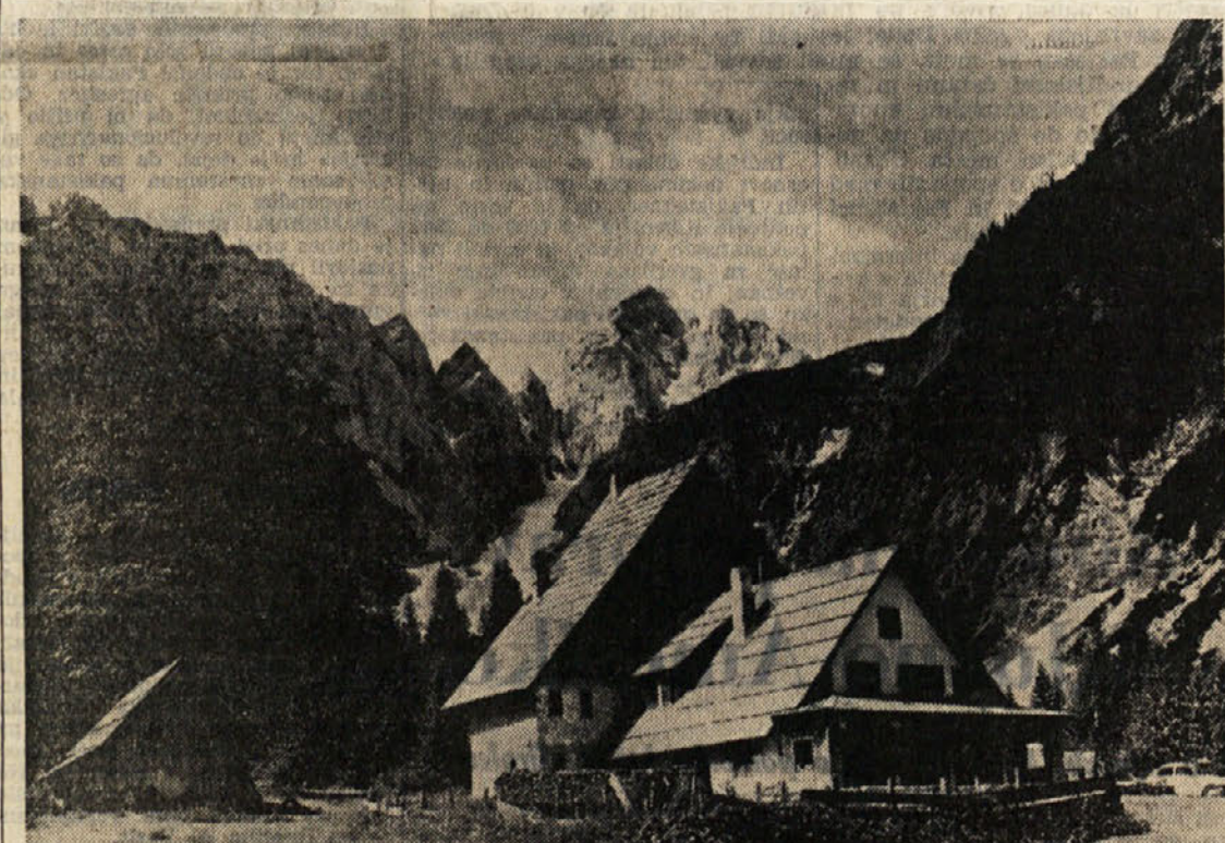
V dolini Tamar pod slikovitim Jalovcem

Komaj sta roparja zapustila banko, sta uradnika poklicala polico, ki je v najkrajšem času razporedila več cestnih blokov, da bi izsledila neznanе roparje. Ti pa so avto 6900, ki so ga verjetno ukradli v Lignano, zapustili in nadaljevali pot z drugim avtomobilom. Preiskava se nadaljuje.