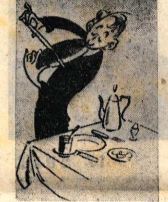
Violinist si reže kruh pred zajtrkom