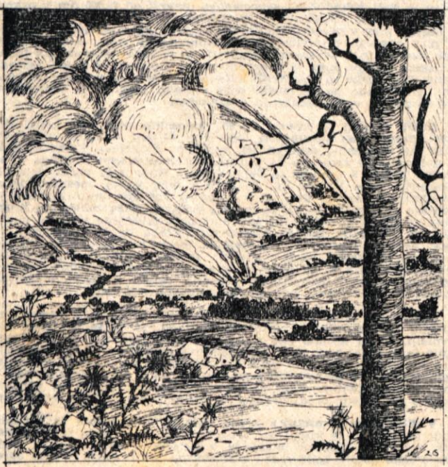
26. Sovražniki so pobesneli zaradi žrtev in porazov. Zapuščali so postojanke v bližini gozdov in se umikali v dolino k cestam in železnicam. V onemogli jezi so požigali vse kar so dosegli. Gorele so bogate domačije in uboge bajte. Cele vasi naenkrat. Iz dneva v dan so se iz obrobni vasi dvigali oblaki dima.