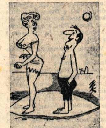
— Opozoril bi vas, da je danes ponedeljek. Kaj ne perete perila v začetku tedna?