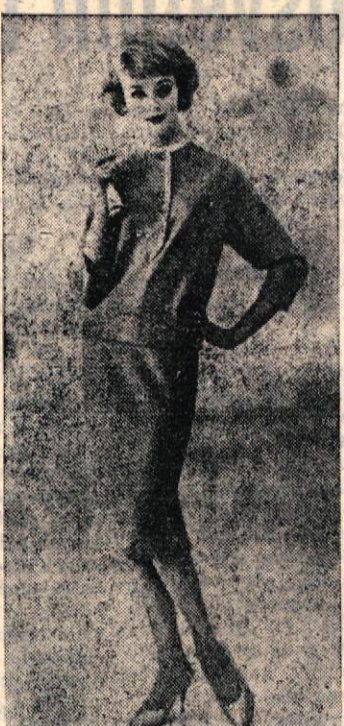
Izredno enostavna in elegantna obleka iz svetlega blaga, ki je okrog vratu in kjer se zapenja, obrobljena s tankim belim trakom

★ Vse kaže, da javna razsvetljava v Kostanjevici ne bo nikoli urejena, saj je dober del mesta že dalj časa spet v temi. O tem problemu je bilo že toliko tožb in besed in pisanja, da bi naše ljudje že kar nič več resno ne jemljejo. Javna razsvetljava je skrajno slabo urejena. Velik del napeljav je še izpred vojne in odtlej menda sploh ni bilo več kakega temeljitejšega popravila. Ker je kajpak tako v celoti dotrajala, ni mogoče misliti, da bi služila svojemu namenu. Kaj storiti, da