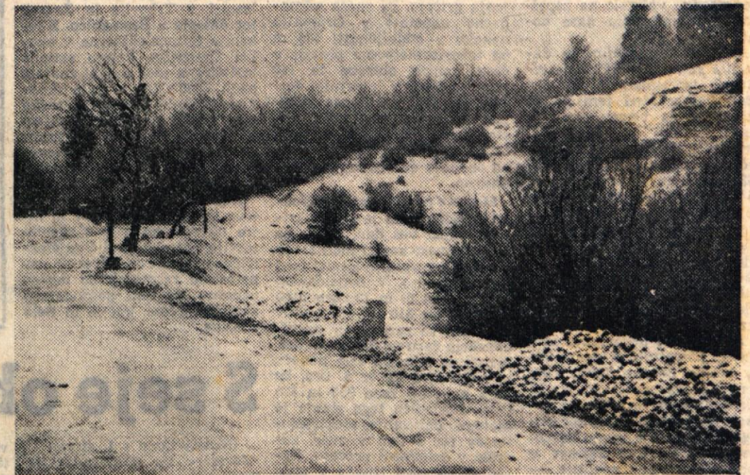
6. novembra 1959 ob sedmih zjutraj na Gorjancih, Močan severni veter je prinesel sneg, ki je pobelil vse vrhove okoli Novega mesta. Semiško goro in višine okoli Rožnega dola do Vršnih sel. Mar naj to pomeni, da se nam obeta dolga zima? Sneg je v naslednjih nočeh zapadel še niže proti dolini in tako — žal — spet enkrat potrdil naše vremenske napovedi.

jajo sedaj delavske univerze že v vseh občinah razen občini Zuzemberk in Trebnje, kjer še pripravljajo njihovo ustanovitev. Zanimanje za dopolnilno šolanje odraslih je zelo veliko. V oddelkih za odrasle pri osnovnih šolah obiskuje v našem okraju tečaje nad 600 ljudi, ki bodo ob uspešnem zaključku prešli spričevalo o dovršeni osemletki. Prav tako imajo nad 100 obiskovalcev tudi oddelki za odrasle pri srednjih strokovnih šolah. V okraju deluje 6 političnih šol z okrog 160 slu-