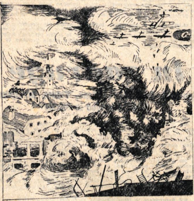
27. Nad hribovskimi vasi so se nekega dne pojavili laški bombniki. Kot ptice roparice so se spuščali nad mirne domačije ter sejali smrt in razdejavanje. Otroke v zibelkah in onemogle starčke so trgale zločinske bombe. Vasi so gorele in se rušile. Danes v Podgorju, jutri po Grčevju, pojutrišnjem pod Rogom...