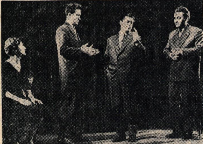
Prizor iz Sylvanusove pretresljive igre

govornih ljudi v trgovinah, ki nam preko izložb vsiljujejo ob praznikih pa tudi ob drugih priložnostih slike karske izdelke umetniško ničvednih in našemu času povsem neustreznih kvalit. Potprejektivost ima tudi glede okusa neke meje. To, kar je dala »Moda« na Glavnem trgu, ali kar je včasih razstavljala trgovina »Tekstil« na istem trgu kot okras ali celo umetniške izdelke, je malo rečeno sramota za mesto, ki se ponaša s plejado likovnih, slikarskih in drugih umetnikov. Če se že ne strinjamo z aranžiranjem trgovskega blaga po izložbah, je to komercialna zadeva trgovine same. Ko pa postavlja naša trgovina zadržano in nepoklican oblikovalec okusa najslabše vrste, je treba to preprečiti in v imenu naše napredne kulture najodločneje odkloniti. nK