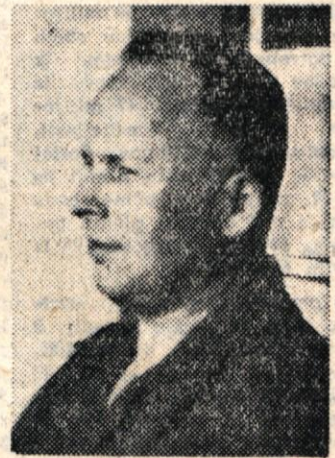
ra SZDL v Novem mestu, od nedavnega pa je njegov podpredsednik.

mlade ljudske oblasti in v delu političnih organizacij. Kot član Okrajnega komiteja KPS je delal na različnih odgovornih mestih vse do konca vojne. Po razpustitvi okrajnega komiteja KP je bil med drugim tudi sekretar OK ZKS okraja Krško, nato okraja Novo mesto in še kasneje okraja Črnomelj. Po združitvi dolenskih okrajev je postal sekretar okrajnega odbo-