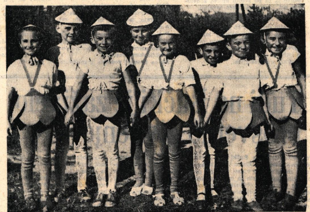
Tole so pa mladi Artičani, ki so proslavili občinski praznik Brežice. Razen otrok in odraslih iz Artič so nastopili tudi Dobovčani s peselnimi in glasbenimi točkami. Spored je bil lep, le škoda, da je bila udeležba slaba

Vsem, ki so tokrat sodelovali, pa jim sreča ni bila mila, želimo več uspeha pri prihodnji »uganki«!