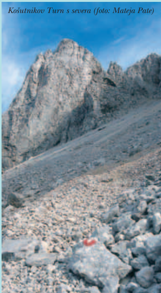
Košutnikov Turn s severa

Prve smeri, ki so segale do V. težavnostne stopnje, so bile zarisane na začetku prejšnjega stoletja, že leta 1935 pa je bila v Direktni smeri dosežena tudi takrat zgornja meja možnega, VI. stopnja. Po drugi svetovni vojni se je začel nov val alpinističnih uspehov, pred kakimi petnajstimi leti pa se je v Karavanke priplazil tudi športnoplezalni duh in tako so začele nastajati moderne, s svedrovci opremljene smeri, izmed katerih je marsikakšna zunaj dometa klasičnih alpinistov, ki se preganjajo po plateh in poklinah Košutnikovega turna. Najtežja smer, opisana v vodniku Komm auf Touren in den Karawanken, Karantanija 2000, se ponaša z oceno VIII-. K sreči je na voljo še nekaj dobro opremljenih smeri zmernejše težavnosti, kamor se lahko zapodijo nekoliko manj trenirani plezalci. Tudi klasične smeri že premorejo svedrovce, če ne drugje, vsaj na varovališčih. Avstrijci so pač vedno znali poskrbeti za varnost. Pri tem jim gre na roko tudi presenetljivo kakovostna kamnina turnoega skalovja.