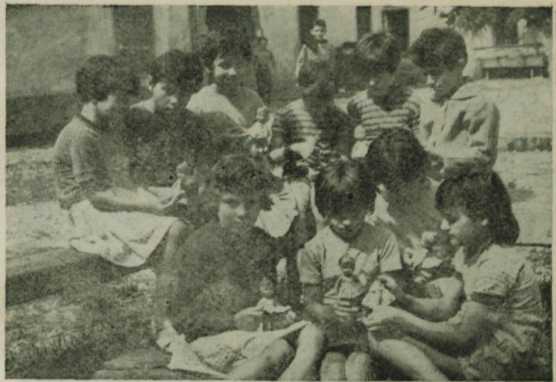
Čeprav daleč od doma so se makedonski otroci tudi v Kamniku prijetno počutili

»Do 20. septembra bomo še v Kamniku, potem pa gremo v Poreč, kjer se bo začel redni pouk. Učenci strokovnih šol bodo šli v večja mesta ali pa v Skopje.« V razgovoru z otroki smo spoznali, da jim je v Kamniku zelo všeč.