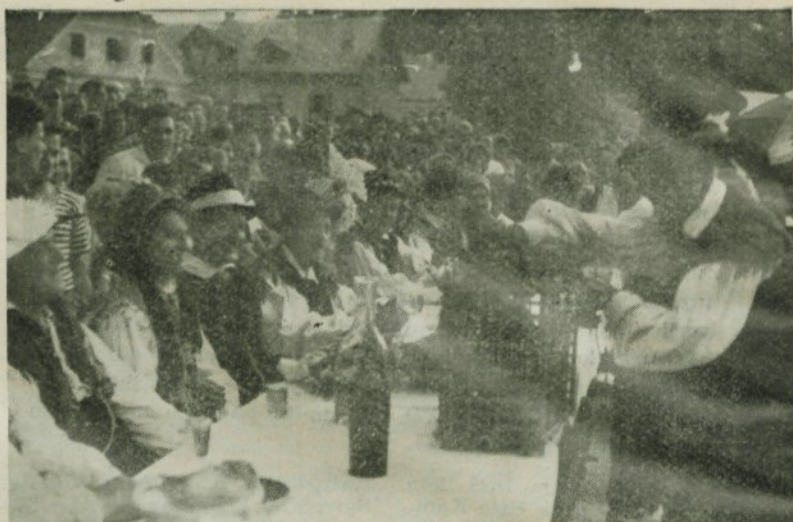
Prijetno razpoloženje na Podgorski ohceti...