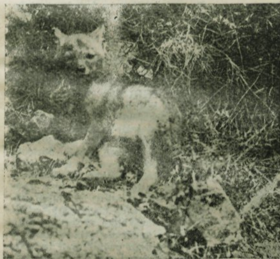
MLADA ŠAKALICA Z OTOKA ŠIPAN

Zaradi gozdnega požara na otoku Pelješcu v letu 1908 so bili šakali prisiljeni preplavati morske ožine med Pelješcem, Olipo in Jakljanom ter so se naselili