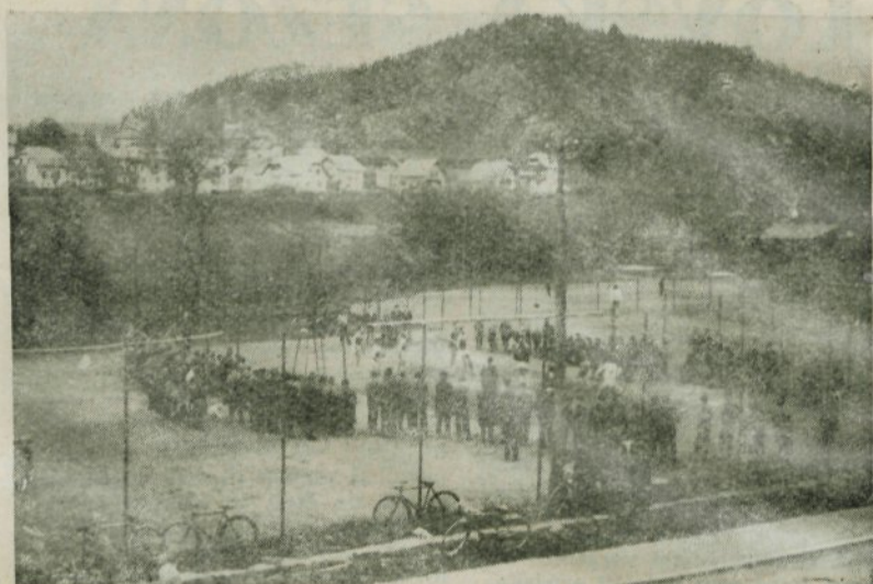
Prvenstvene odbojkarške tekme na lepih igriščih pri kopališču privabljajo vedno več vnetih navijačev