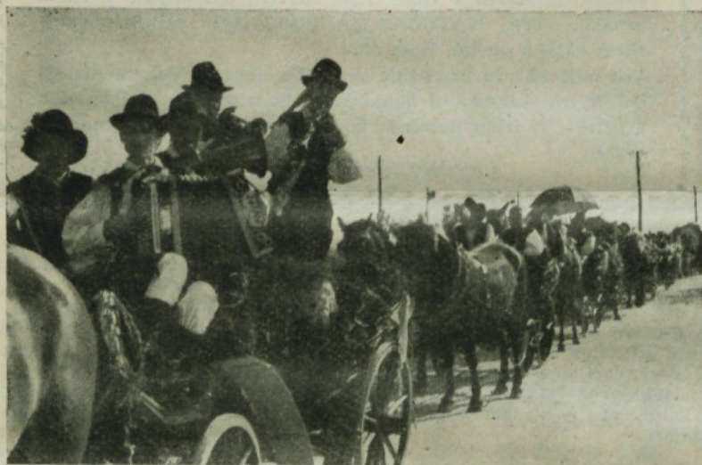
Na čelu svatbenega spreveda so podgorski fantje urezali marsikatero poskočno