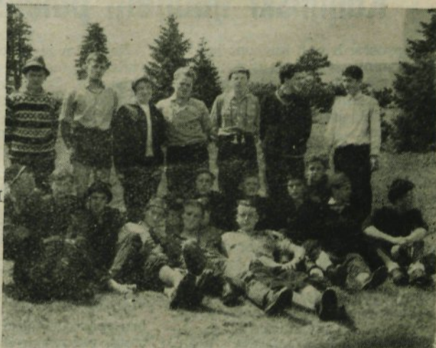
MLADI GORSKI VODNIKI PO IZPITU NA VELIKI PLANINI

skih vodnikov je vodilo enaintrideset skopskih pionirjev, ki so bivali v Kamniku, na Veliko planino; trije mladinski vodniki so se udeležili zveznega tečaja v Gorskem kotarju itd.