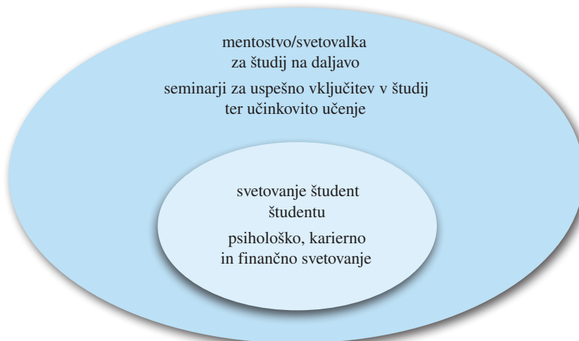
Slika 4. Vključenost študentov v svetovalne dejavnosti Centra za svetovanje