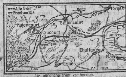
Die nördliche Front vor Verdun.

Z ozirom na zadnja uradna poročila o velikanskih bojih okoli Verduna prinašamo danes mali zemljevid, ki predstavlja severno fronto pred Verdunom.