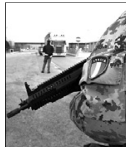
Vojak na meji