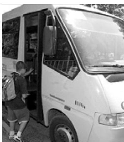
Na avtobusu je bilo 14 otrok BUMBACA

Pri Fari se je včeraj zjutraj zgodila prometna nesreča, v katero sta bila vpletena dostavno vozilo in šolski avtobus. V trčenju je nastala večja materialna škoda, k sreči pa ni bil poškodovan nihče izmed voznikov in osnovnošolskih otrok, ki so se peljali z avtobusom. Bilo je le nekaj preplaha.