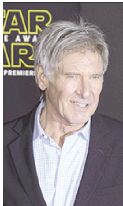
Harrison Ford se vrača za krmilo vesoljske ladje Millennium Falcon; zgoraj mlada Daisy Ridley in John Boyega

Film bo danes zagledal luč v italijanskih in slovenskih filmskih dvoranih. Za ogled filma v 3D tehnologiji, ki bo pre-