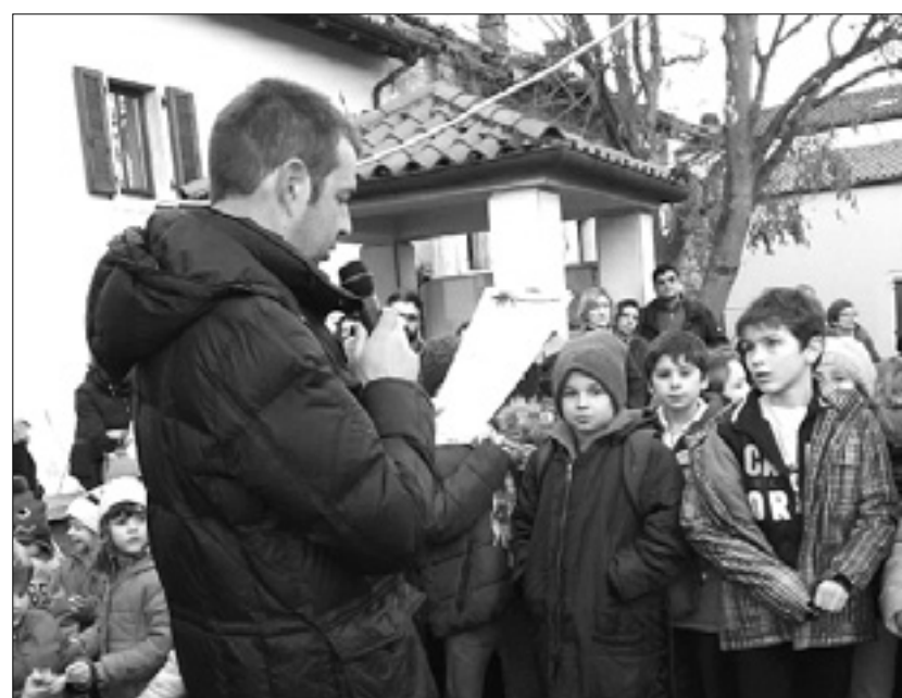
Otroke so pred kavarno Gruden čakale sladice, vroča čokolada in čaj

JUS NABREŽINA - Preteklo sredo prižig lučk na osrednjem trgu v Nabrežini