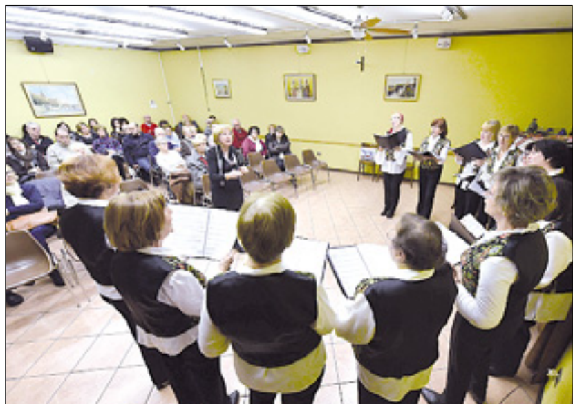
Škedenjke in gostje so občinstvu pripravili bogat pevski spored

Zbora Dotik in Slav'na v gosteh pri ŽPZ Ivan Grbec