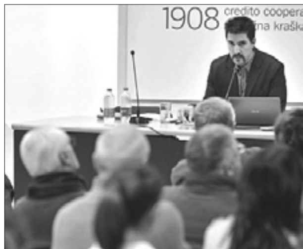
Predavanje o islamu je izzvalo veliko zanimanje FOTODAMJ@N

»Islam pomeni predanost enemu in edinemu Bogu«