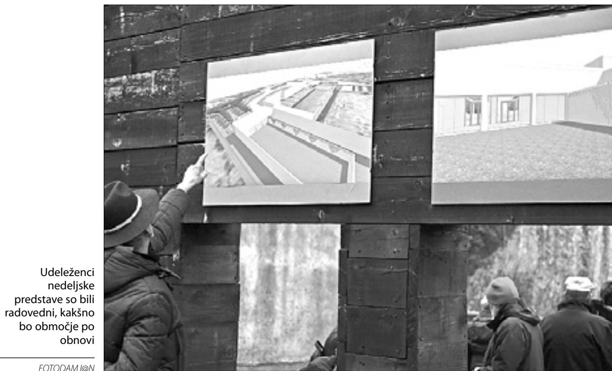
Udeleženci nedeljske predstave so bili radovedni, kakšno bo območje po obnovi