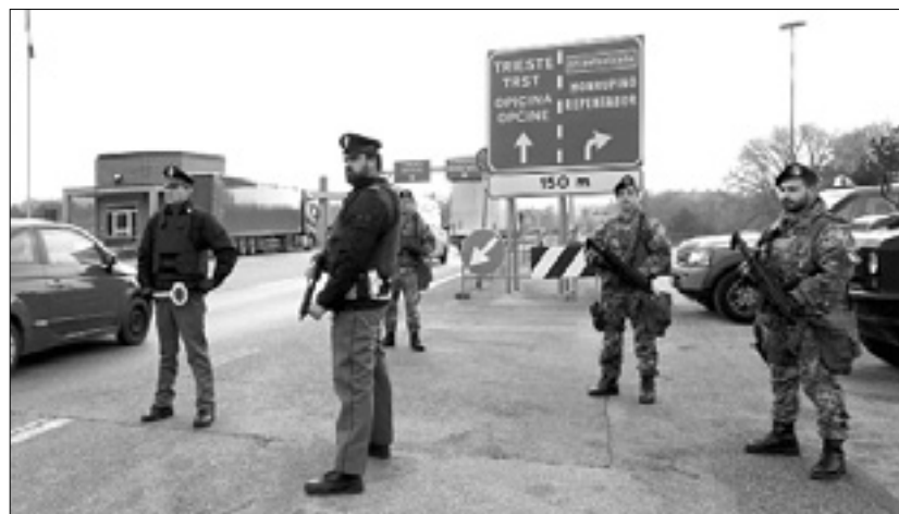
Na mejnem prehodu pri Fernetičih so se policistom pridružili vojniki