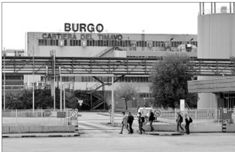
V štivanski papirnici ne bodo odpustili nobenega delavca

To bo v grobih obrisih prihodnost štivanske papirnice glede na dosedanja pogajanja med skupino Burgo in sindikalnimi organizacijami, ki naj bi se zaključila jutri ali najkasneje v petek v Vicenzi. Sindikalni predstavniki zaposlenih v papirnici, ki so včeraj na skupščini razložili izid dosedanjih pogajanj, so namreč prejeli od delavcev mandat, da zaključijo pogajanja glede obnove 2. produktivne linije. Kar pa zadeva napovedi o morebitnemu zmanjšanju plače in ukinitvi nekaterih doklad in ugodnosti, bodo skušali sindikati doseči čim večjo plačo. Toda vsem je jasno, da je štivanska papirnica edina v skupini Burgo, kjer še uživajo te ugodnosti in je torej njihova usoda dejansko zapečaten. Predstavniki tržaškega sindikata Cgil