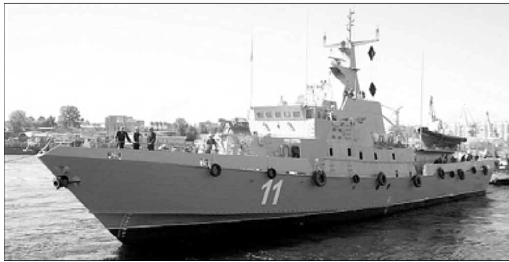
Večnamenska ladja slovenske vojaške mornarice Triglav