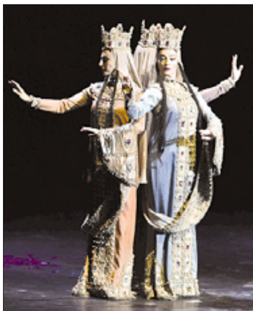
Izvrstni gruzijski plesalci