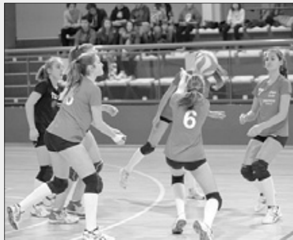
Odbojkarice Zaleta Sloga Dvigala Barich under 16

Trener je preizkusil v postavi različne variante in vse igralko, tudi v vlogah, v katerih ponavadi ne igrajo. Potek tekme pa se ni bistveno spremenil, saj so domačinke obdržale koncen-