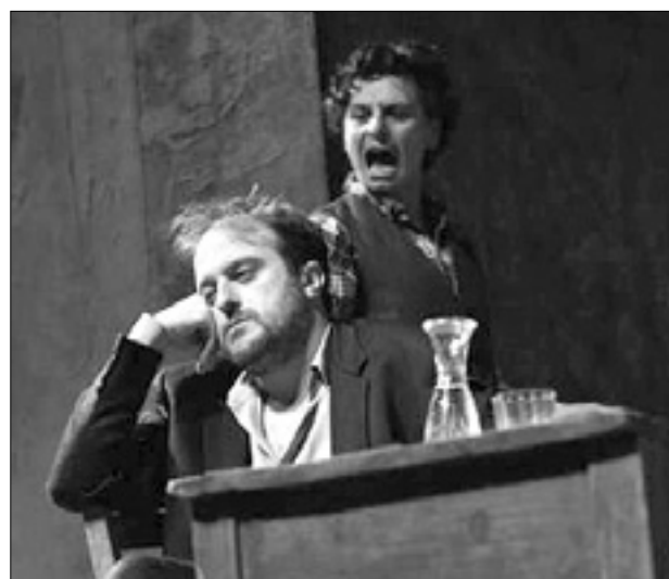
Prizor iz drame Ivanov Antona Čehova