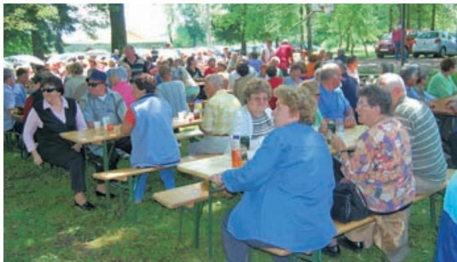
Društvo upokoјencev Smlednik je lani organiziralo srečanje upokoјencev občine Medvode.