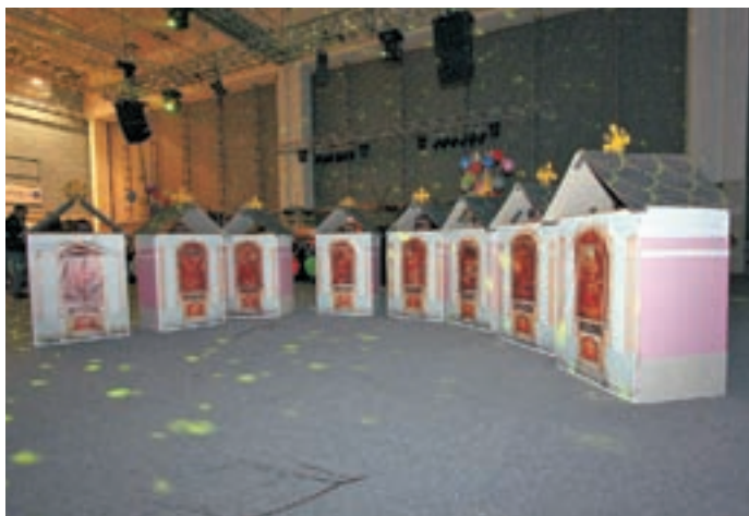
Domišljije ne zmanjka - nekaj se jih je "obleklo" kar v smledniško Kalvarijo in razglašeni so bili za najatraktivnejšo skupinsko masko.