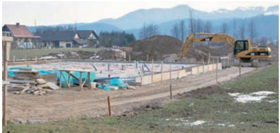
Na Jeprci gradijo delavnice Društva Barka. Odprtje načrtujejo za prihodnjo pomlad.