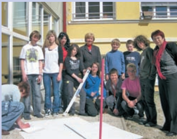
Nagrajeni video prikazuje tudi učence iz Preske med merjenjem dolžine sence, ki jo ustvari palica.