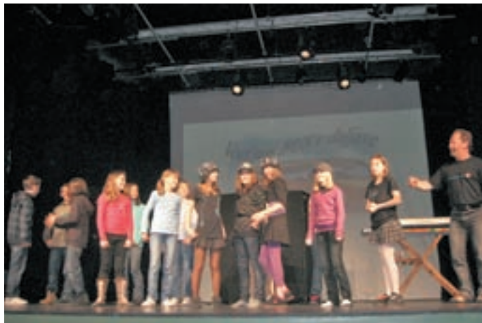
Dobrodelno prireditev so učenci sklenili s skupinskim plesom Kengoru.