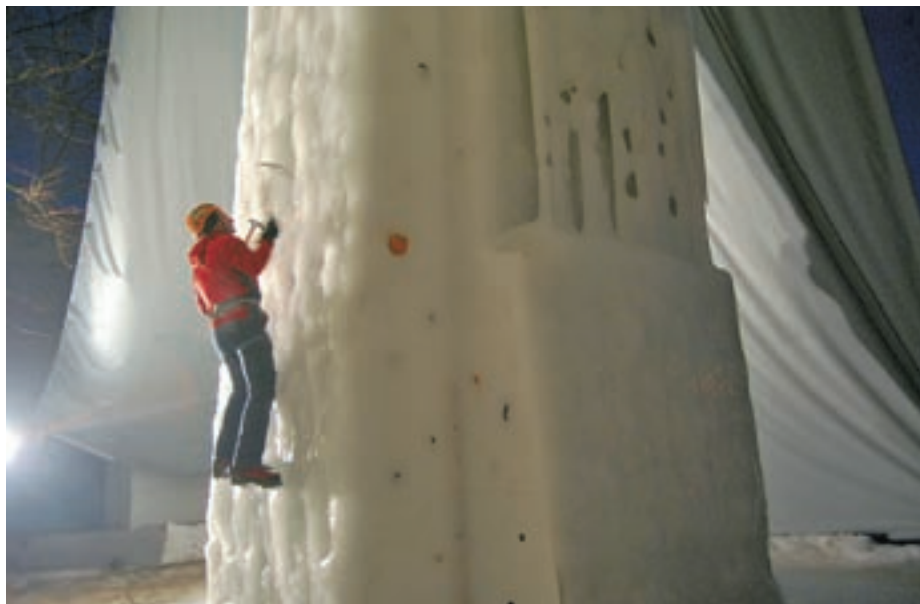
Stolp je vsakokrat malce drugačen, plezanje na njem pa rekreativcem predstavlja velik užitek.

Stolp je med tednom odprt od 16. ure dalje, za plezanje ob sobotah in nedeljah pa je zaželena predhodna najava. Je pa ob stolpu predvideno tudi drsališče, na katerem bo predvidoma moč drsati od jeseni dalje. Maja Bertoncej