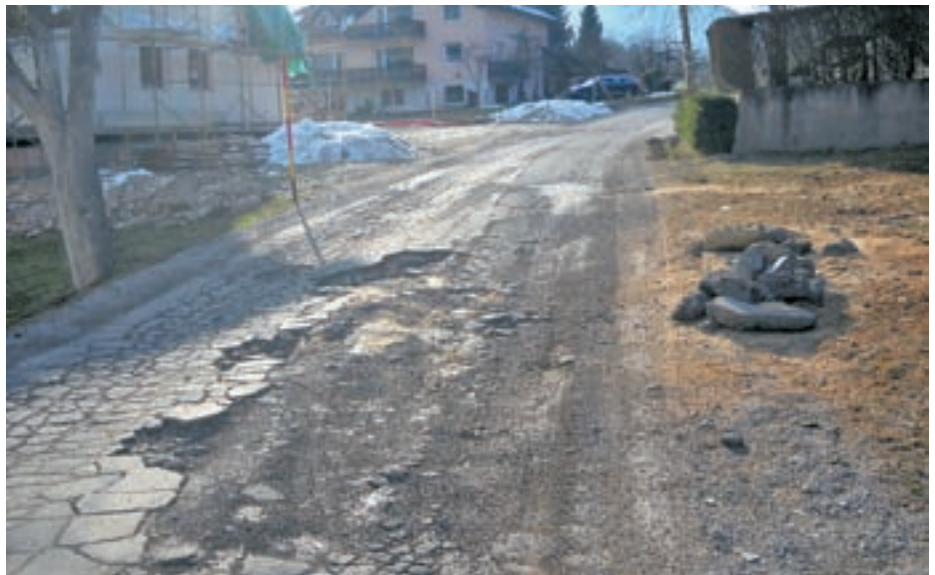
Huda zima in intenzivno posipanje sta pustila posledice tudi na cestah. Na sliki cesta v Žlebeh.