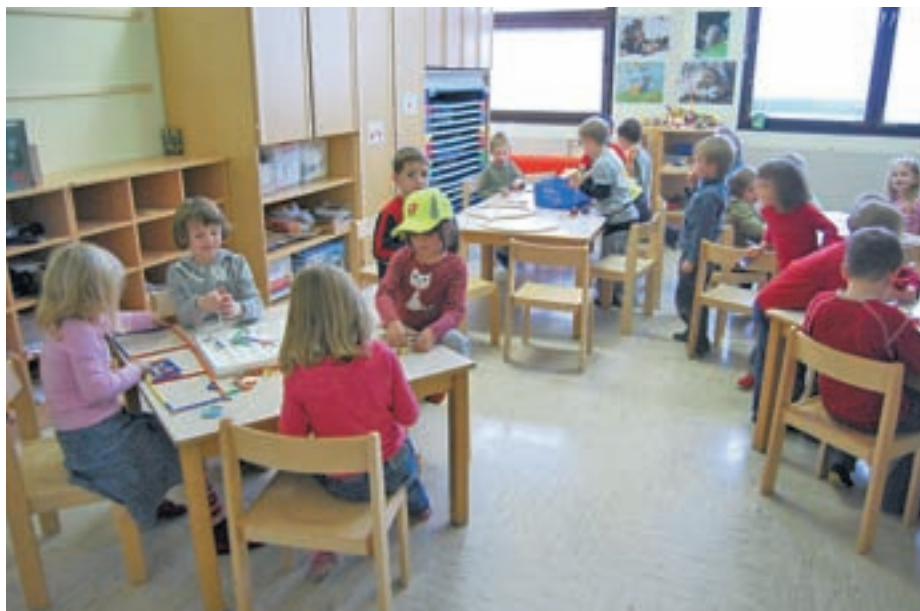
V Vrtcu Medvode bodo na novo najverjetneje lahko sprejeli nekaj več kot sto otrok.

Koliko bo prostih mest, je v tem trenutku še nemogoče napovedati, saj ni znano, koliko otrok, rojenih leta 2004, bo odšlo v šolo. Nekateri starši otrok, ki so bili rojeni proti koncu leta, so namreč zaprosili za prestavitev vstopa v šolo za eno leto. "Predvidevamo, da bo prostih 115 mest, dokončna številka pa v tem trenutku še ni znana. To pomeni, da bomo lahko na novo sprejeli približno toliko otrok kot lani," je še dejala Epihova, ki prav tako še ne