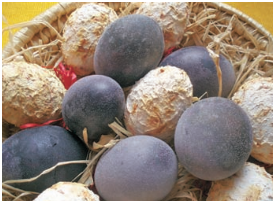
Pirhi, kuhani v teranu, so vijolične barve. Na njih se nabere vinski kamen, ki daje videz bleščic.