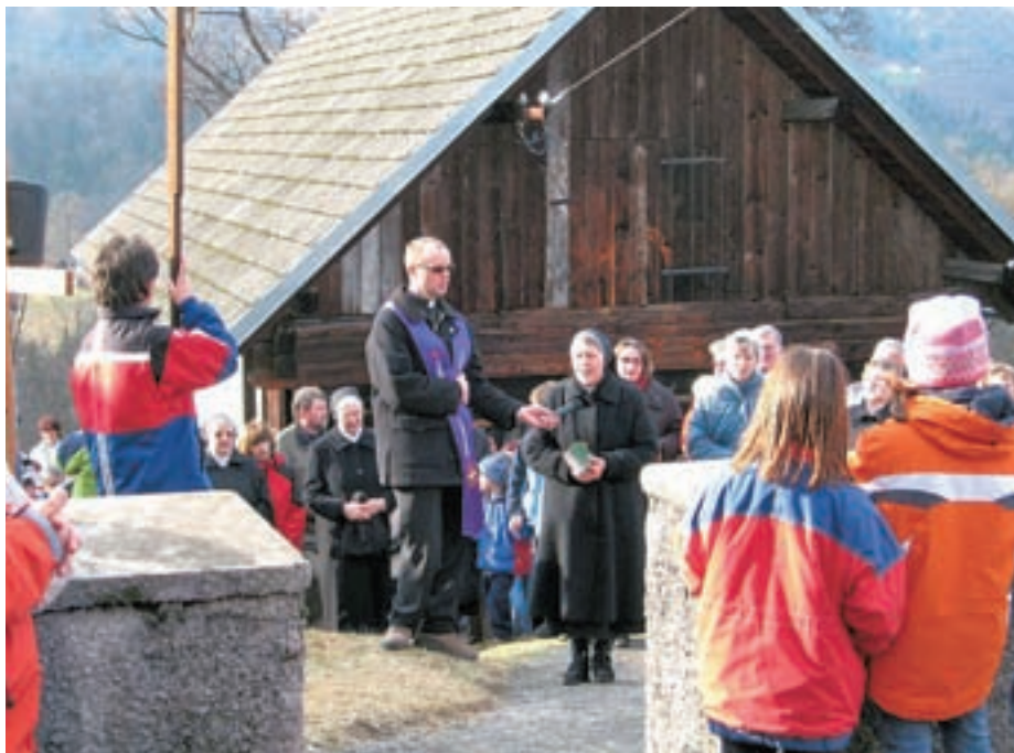
Na tiho nedeljo se zberejo verniki iz župnij šentviške dekanije k molitvi križevega pota na poti proti cerkvi sv. Marjete v Žlebeh.