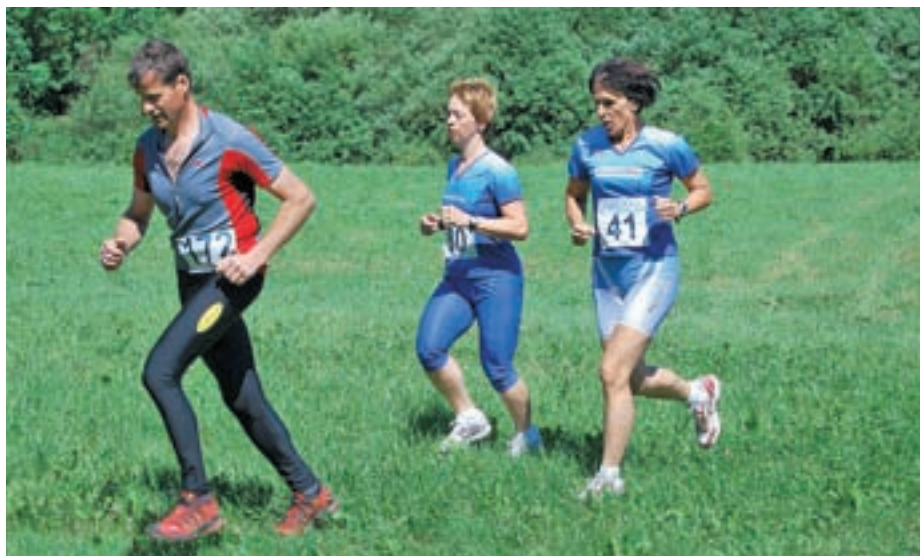
Za dobro telesno kondicijo skrbimo z redno telesno vadbo, tudi s tekom v naravi.

In ko imamo primerno obutev ter oblačila, se lahko pripravimo na tek. Pomembno je vedeti, da se na tek ne odpravimo lačni oziroma tudi ne s polnim želodcem. Uporabno pravilo za tekača je, da naj pred tekom mineta več kot dve uri od glavnega obroka. Priporočljivo je tudi, da pred tekom ne posegamo po težki hrani (bo-