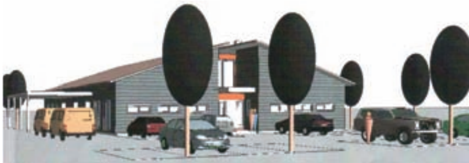
Pogled na nove delavnice je zaenkrat mogoč le na papirju, kmalu bo tudi v živo, saj bodo montažni objekt začeli postavljati še ta mesec.