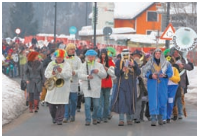
Na čelu nedeljske pustne povorke so bili tudi letos člani Godbe Medvode, sledile pa so jim pustne šeme vseh vrst.