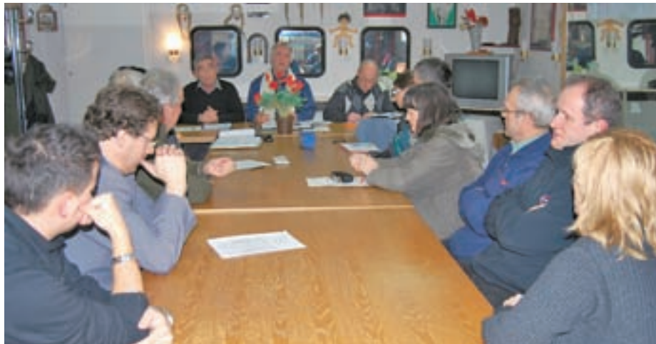
V civilni iniciativi Pirniče so sklicali posvetovanje na temo Betonski mostovi na Sotočju ali Zelena vrata glavnega mesta.

kaj let nazaj bi se lahko bistveno več naredilo in morda sploh ne bi prišlo do te situacije. Poleg tega nikoli nobena varianta ne bo sprejemljiva za vse in verjetno bi se tudi na trasi Jeprca-Vodice našli ljudje, ki bi temu nasprotovali."