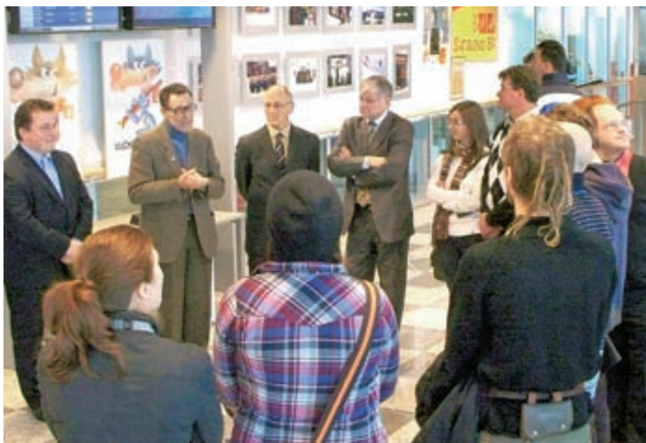
Utrinek z odprtja razstave