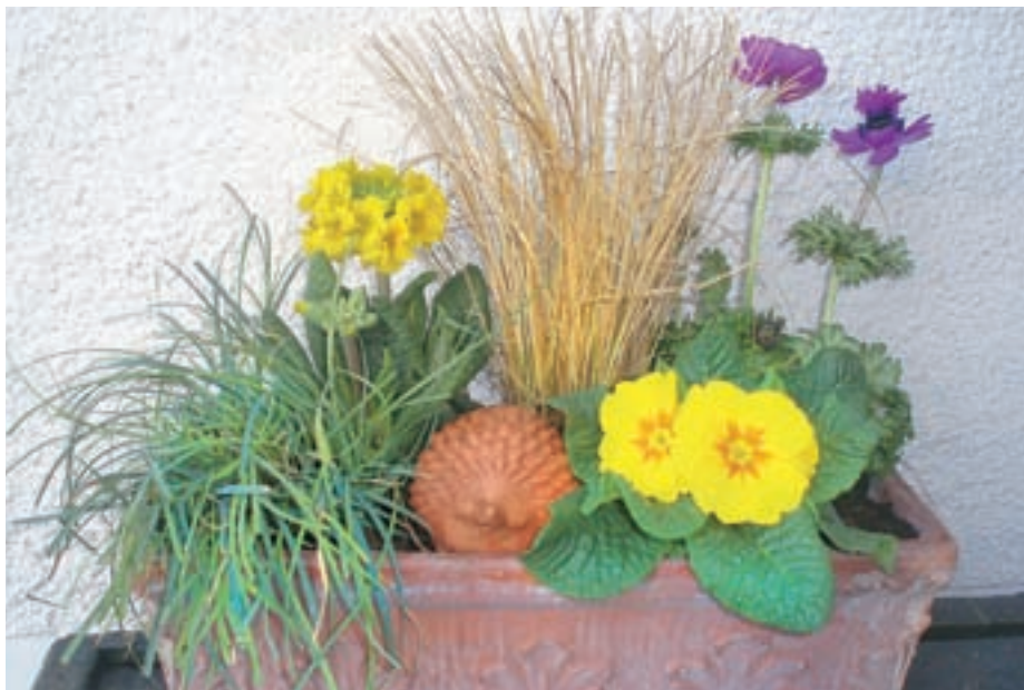
Na okenskih policah in loncih osvežimo jesenske zasaditve.

V okrasnem vrtu očistimo trajnice gnilih in pomrznjenih delov. Okrasne trave porežemo malo nad tlemi. To storimo tudi z drugimi rastlinami, ki jim pozimi odmrejo nadzemni deli. Pol zimzelene trajnice le obrežemo, da ohranimo kompaktno rast. Sedaj je tudi čas, da trajnice presadimo, ali pa posadimo nove. Če rastlin nismo pognojili že v jeseni, je sedaj pravi čas, da to storimo. Marca očistimo tudi trato. Pregrabimo jo z železnimi grabljami. V dežju ali tik pred njim po trati raztrosimo gnojilo za trato. Ko se travna ruša osuši, jo lahko mulčimo in prezračimo. Na predelih, kjer je trata redka, jo dosejemo. Poleg čiščenja je sedaj tudi čas za obrezovanje. Obrezovanja bo zagotovo največ v sadovnjaku. Poleg drevja se sedaj obrezujejo tudi vrtnice, metuljnice, hortenzije, ruj, jagodičevje in ostale grmovnice. Obrežemo tudi plezalke (srobote, glicinije, jasmínove trobe ...). Na zelenjavnem vrtu lahko, če so tla dovolj osušena, že sejemo grah, bob, motovilac, špinačo in sadimo čebulček. V zabožke v rastlinjakih in na okenskih policah sejemo ob-