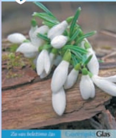
Na naslovnici: Zvončki naznanjajo pomlad

PRILOGA GORENJSKEGA GLASA O OBČINI MEDVODE Letnik št. ISSN 1580-0547 SOTOČJE Marec 2010 • Številka 2