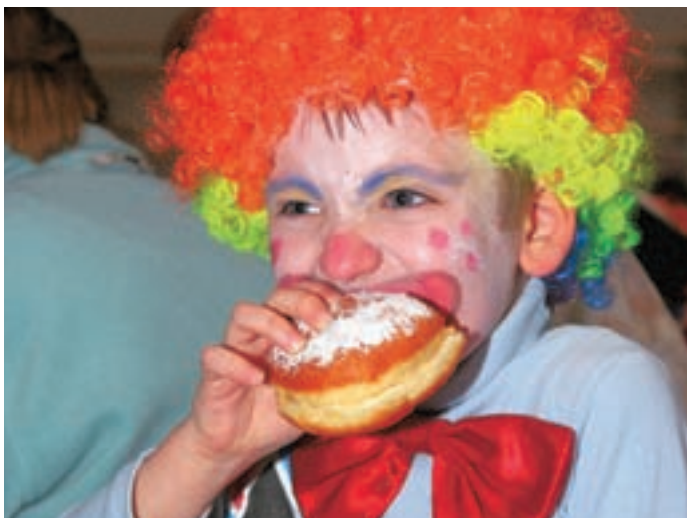
Med nedeljskim rajanjem so bili krofi zelo dobrodošli.