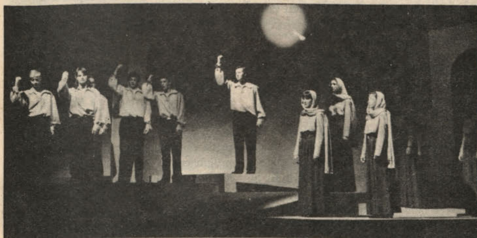
Prizor iz spominske proslave „V srcu zvestoba“.

Naj omenimo še to, da so demokratične stranke želele nove, manjše občine, levičarske pa bi raje ostale pri starih, kjer so delavska velika mesta nadvladale nad kmečkim prebivalstvom.