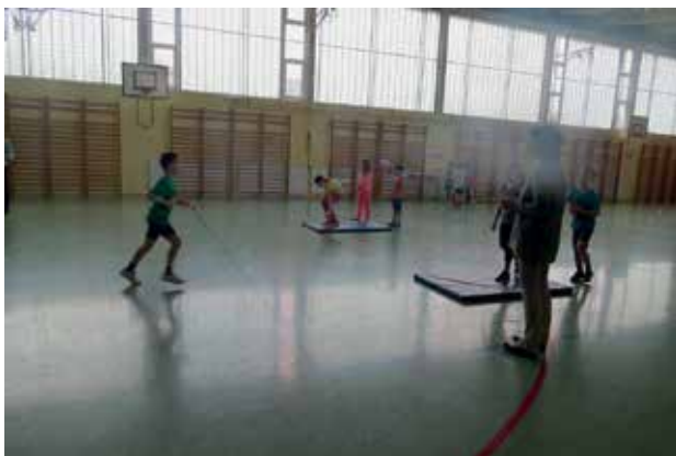
Slika 4: Olimpijski potres.

Navodila: Tekmovalci se morajo izkazati v natančnosti in spretnosti. Vsak tekmovalec ima tri teniške žogice in ko tekmuje, stoji na blazini. Kotaliti jih mora proti devetim kijem, ki so postavljeni na primerni razdalji. Vsak izbit kij prinese po eno točko. Vsak učenec pride dvakrat na vrsto.