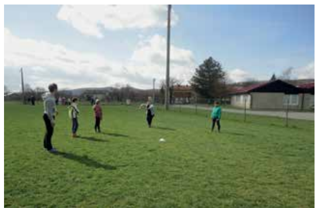
Slika 6: Olimpijski met.

Navodila: Igra se odvija na travnatem nogometnem igrišču. Vsaka država mora vreči enkrat mali vorteks, drugič pravi vorteks. Vsak predstavnik države vrže vorteks in kjer ta pristane, začne metati drugi tekmovalec iz iste države. Ko zadnji vrže otroški vorteks, skupina postavi klobuček z napisom svoje države. Ko vse države opravijo nalogo z otroškim vorteksom, sledi ponovitev s pravim. Na koncu se vse točke seštejejo. Tekmovalci se pri tej igri zelo spodbujajo in navijajo drug za drugega, po koncu pa vsi skupaj v hitrem teku prinesejo vorteks za met naslednje države.