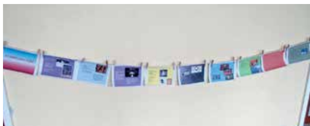
Slika 2: PowerPoint predstavitev »Olimpijske igre«.

Učence in učenci zadovoljujejo potrebe po gibanju, gibalnem izražanju in ustvarjalnosti, se sprostijo in razvedrijo. Razvijajo medsebojno sodelovanje, spoštujejo lastne in tuje dosežke, utrjujejo samozavest in pridobivajo trajne športne navade (prav tam).