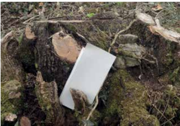
Slika 7: Lov za zakladom.

Na koncu je potekala prava podelitev, kjer so tri najboljše uvrščene države prejele olimpijske medalje in praktične nagrade. Da pa ne bi bilo veliko drugače od pravih olimpijskih iger, so tekmovalci zmagovalne države prisluhnili tudi himni zmagovalne države.