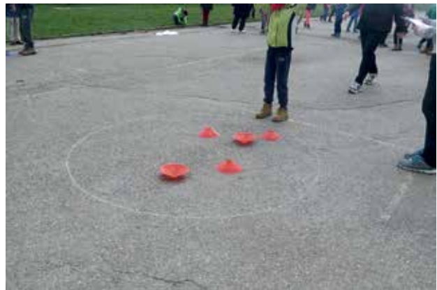
Slika 5: Slepi križci.

Navodila: Cilj igre je orientacija v prostoru. Nastopata dve državi hkrati. Vsaka država ima nekaj metrov pred seboj s kredo narisani krog. Vsak, preden se mu zaveže rutica okrog oči, si natančno pogleda in oceni, kje se krog nahaja. Sledi hoja z zavezanimi očmi proti krogu. Vsak tekmovalec ima 5 klobučkov, ki jih mora postaviti v krog. Vsak klobuček znotraj kroga skupini prinese točko. Vsak učenec pride na vrsto dvakrat.