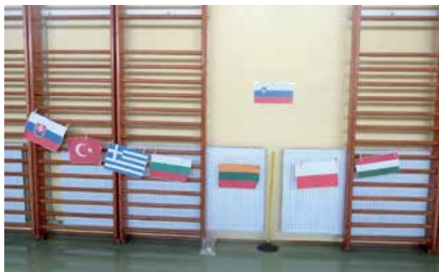
Slika 1: Zastave držav članic projekta.

V Konceptu dni dejavnosti (MIZS, 1998) so zasnovani cilji učenkam in učencem omogočiti utrjevanje in povezovanje znanja, pridobljenega pri posameznih predmetih in predmetnih področjih, uporabljanje tega znanja in njegovo nadgrajevanje s praktičnim učenjem v kontekstu medsebojnega sodelovanja in odzivanja na aktualne dogodke v ožjem in širšem družbenem okolju.