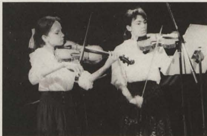
Duo violin iz Ljubljane

Z veliko pozornostjo smo prisluhnili tudi mladim zborovodjem, ki v okviru glasbene šole obiskujejo zborovodsko šolo. Veseli nas, da so med njimi tudi ženske. Dejstvo, da je to že druga generacija, ki bo zaključila tako šolanje, dokazuje, da tudi na področju zborovodstva dobivamo mlad in kvalificiran kader.