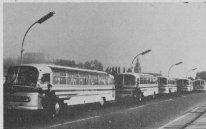
Avtobusni park Komunalnega podjetja Ptuj

Podjetje je zelo uspešno končalo jubilejno leto 1972, saj je ustvarilo bruto dohodka nad 2,3 milijarde starih din, oz. 52% več kot leta 1971; čistega za sklade pa 143 starih milijonov pri 225 zaposlenih. Osnovna sredstva so se od združitve dalje povečala za 8,2; poslovni sklad pa za 6,5 krat, iz česar lahko