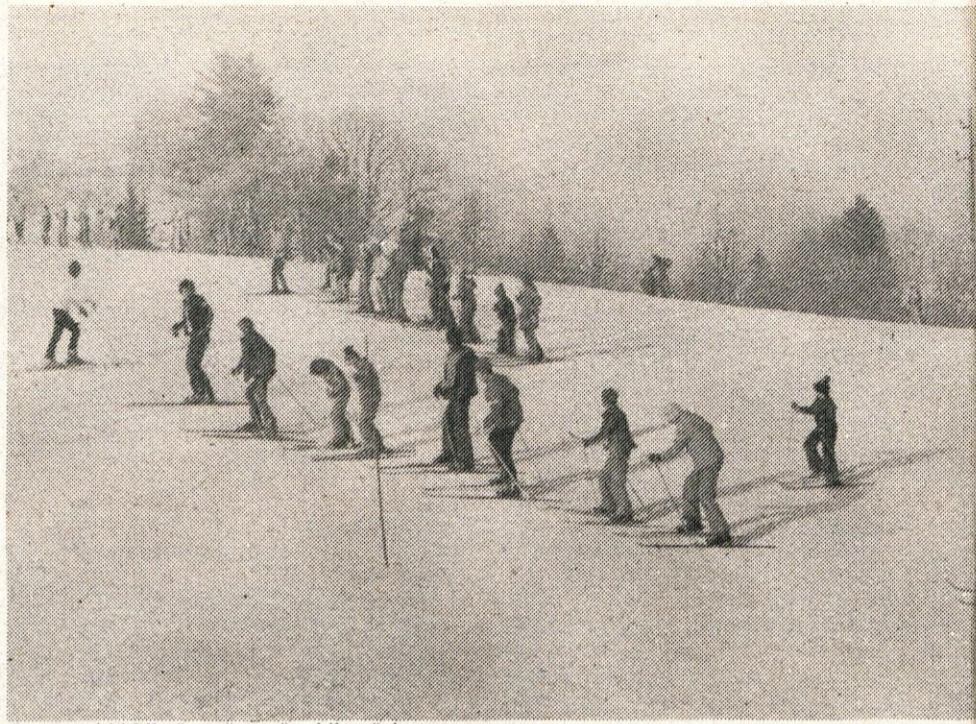
Letos naj bi bilo še več smučarskih tečajev