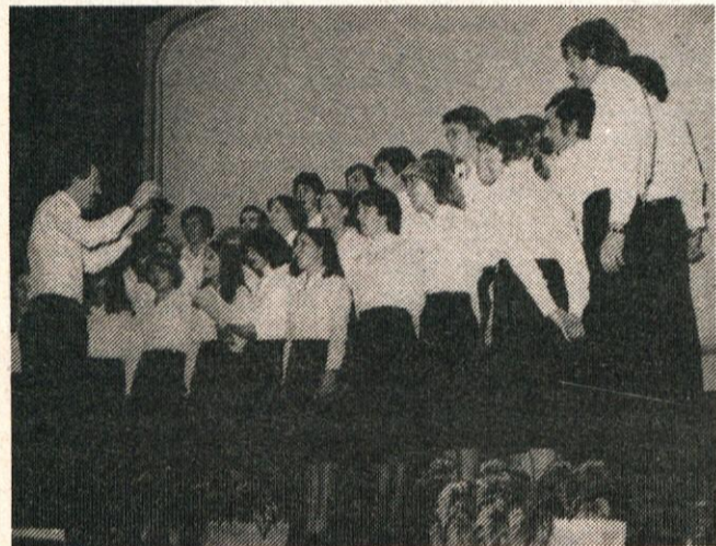
Rožani na kamniškem odru

Čprav zbor iz Roža vadi in nastopa šele peto leto, je bilo njihovo ubrano in sproščeno petje dovolj zgovoren dokaz prizave