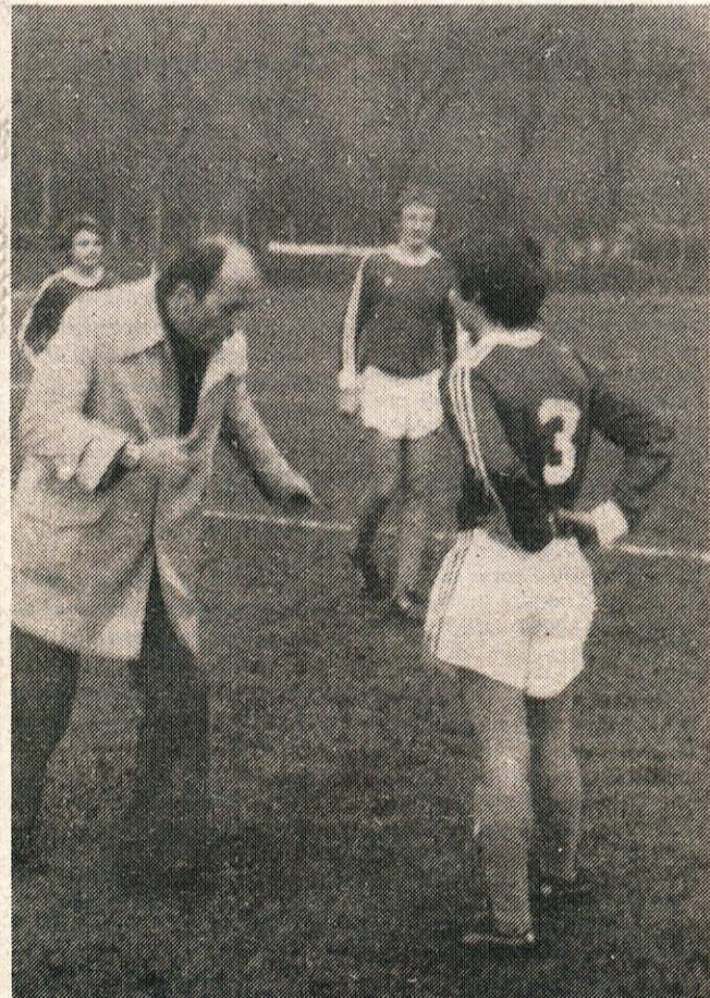
Nasvet trenerja je koristen