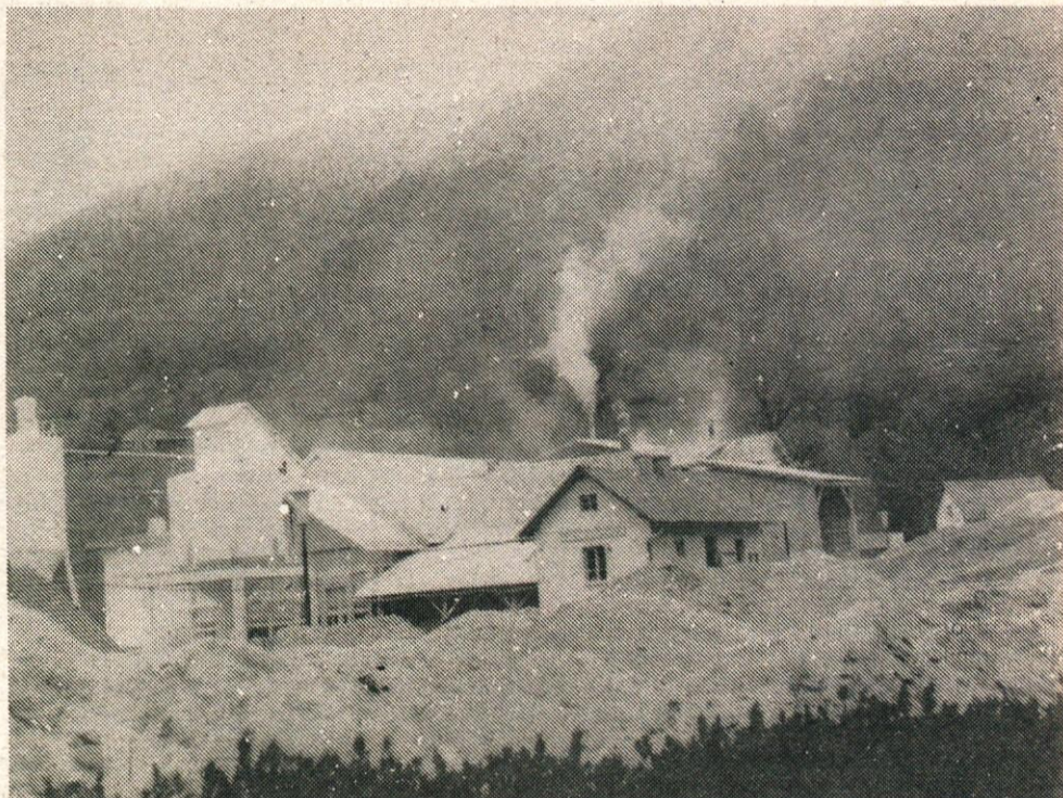
Prašna zavesa v Stahovici

na onesnaževanju okolja, nima velike bodočnosti. Zato bi kazalo pri načrtovanju novih zmogljivosti v vseh dejavnostih temeljito proučiti vse ukrepe za varstvo okolja, ki naj bodo dovolj učinkoviti. Onesnaževanje zraka v Stahovici, kjer naj bi se začel celo narodni park, je treba učinkovito odpraviti.