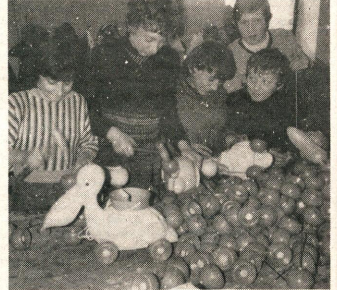
Proizvodnja je že stekla

Ustanovitelj centra v Mengšu je domžalska samoupravna interesna skupnost za socialno varstvo, vendar bodo kasneje ustanovitelji vsi, ki so podpisali samoupravni sporazum o ustanovitvi centra.