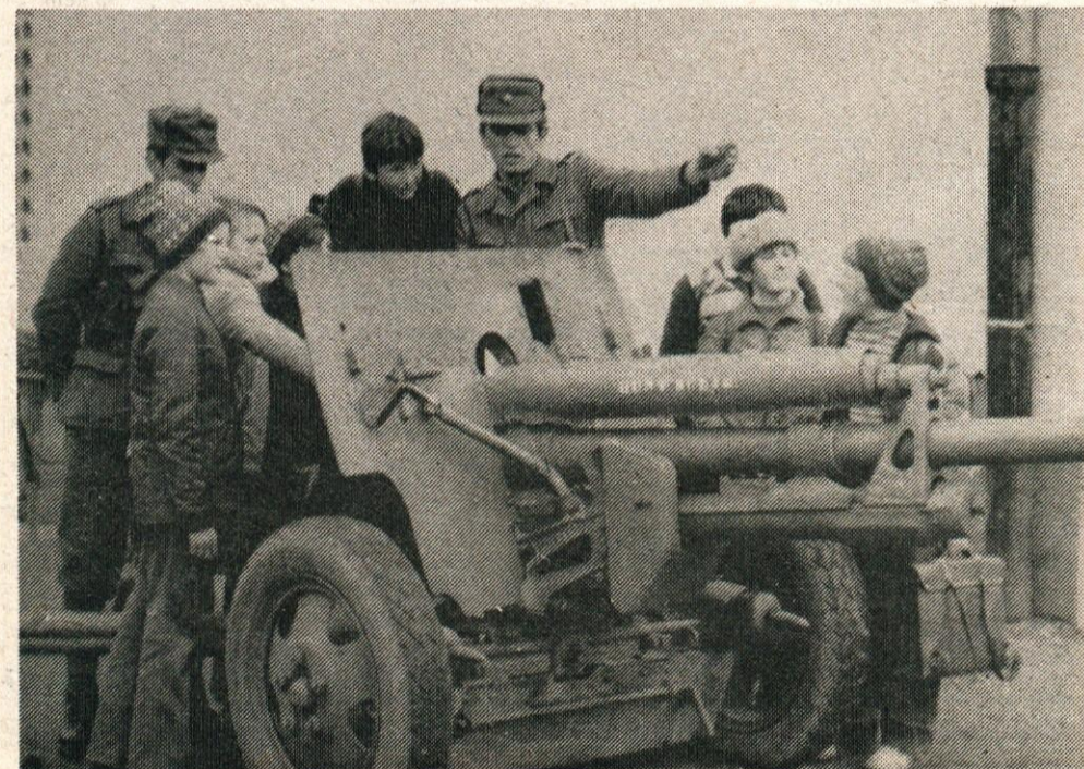
Top nam ne bo več neznanica