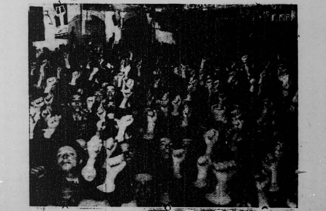
navdušeno pozdravlja govornika Združene Narodne Fronte. Kot znano, so pri zadnjih španskih volitvah zmagali komunisti, socijalisti in drugi radikalni elementii