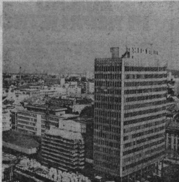
Poslovna zgradba Metalke z novo blagovnico — delo GP Obnove

Vsem bežigradskim občanom kot tudi svojim poslovnim prijateljem želi kolektiv Obnove srečno in uspešno novo 1973. leto.