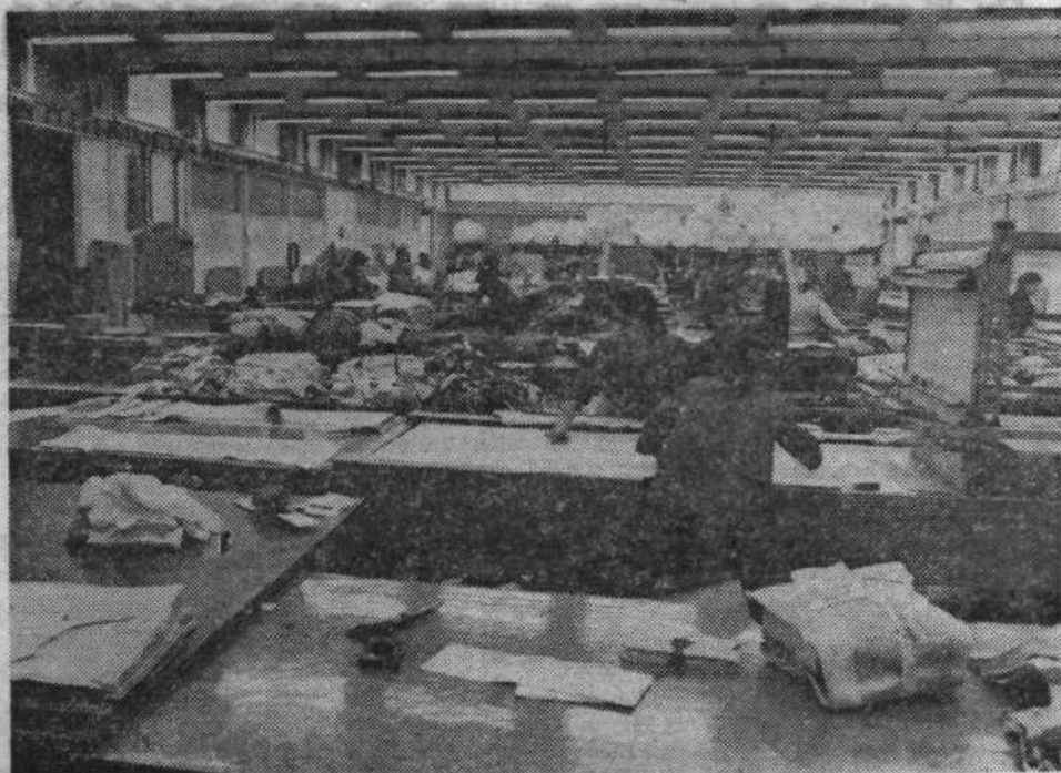
Pogled v krojilnico podjetja TIP-TOP.

Tip-top ima razen v Ljubljani svoje obrate še v Idriji, Na Krki, v Trebnjah in v Boh. Bistrici.