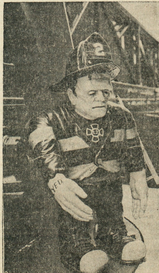
NE BO DOSTI POMAGAL — Mali Frankenstein v gasilski uniformi ne bo pomagal njujorskim gasilcem pri gašenju požarov, služi jim le v zabavo v urah brezdelja.