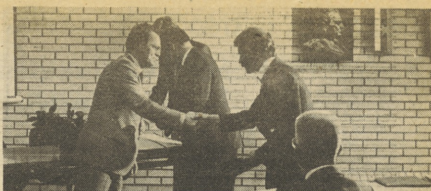
S podelitve diplom slušateljem ZT šole.