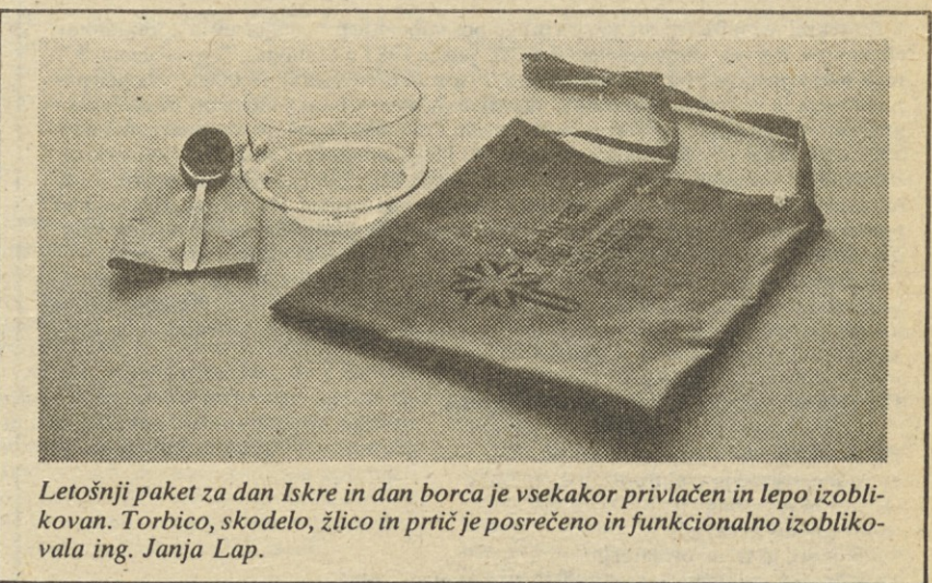
Letošnji paket za dan Iskre in dan borca je vsekakor privlačen in lepo izoblikovan. Torbico, skodelo, žlico in prtič je posrečeno in funkcionalno izoblikovala ing. Janja Lap.