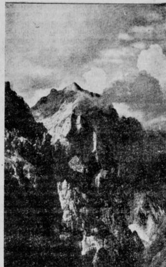
Razor s Križkih podov