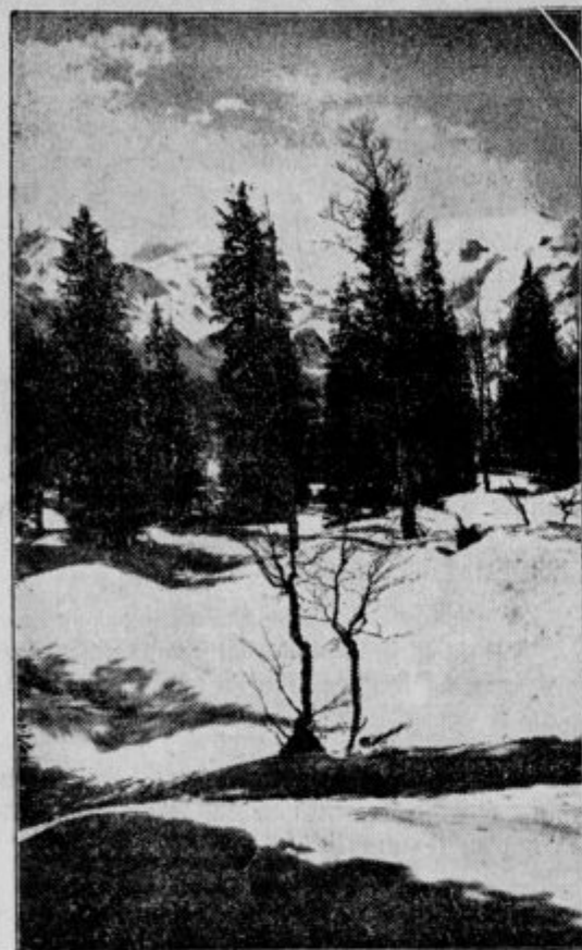
Jutro na planini Vogel

In takrat se zgosti v tebi spoznanje, otreseš se vsega, kar si prinesel s seboj bolnega, zdrav završneš v noč, da se tvoj vrisk raz-