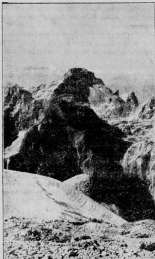
Pogled na Razor s Kredarice