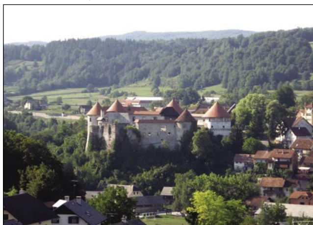
Srejdi Suhe krajine stogi grad Žužemberk

so Ribničani odavali štiristau fele škeri. Redili so posaude, kijauke, site, mlašeče špile pa dosta vsefelé drügo. Škeri pa so mogle priti do küpcov. Pri tom so pomogli »krošnjari«, štéri so odavali v Avstriji, na Vogrskom, na Češkom, v Galiciji pa na Ro-