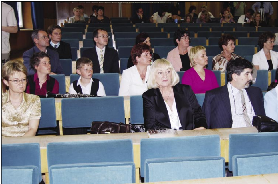
V drugi in tretji vrsti nekdanji porabski študentje