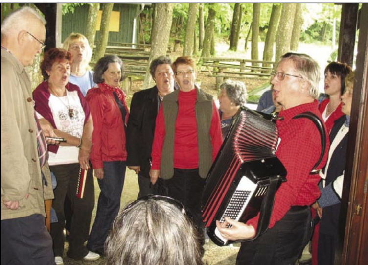
Na trnaci djagerske kuče spejvata badva zbora vküper

poglednili nauvo zidino, šteroro so prejkdali pred šestimi