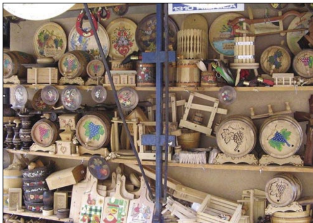
V modernom cajti eške itak odavajo suho robo

Z bregauv pa gaušč Kočevsko pride popotnik pá v edno dolino, v šteroj pela pošcija od varaša Kočevje prauti Ljubljani. Prva kak pa bi se povrnauili v glavni varaš, se oslejdjnjin stavimo v dolenski varašaj.