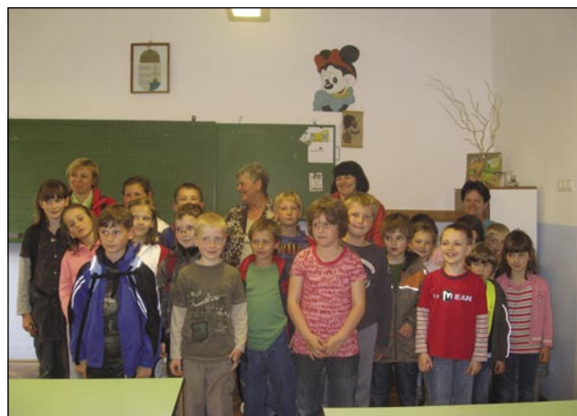
Kroški in monoštrski učenci