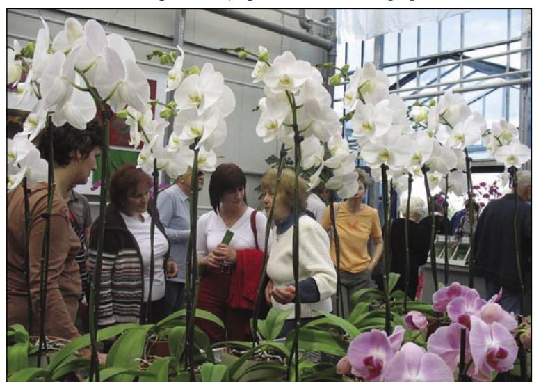
V Dobrovniku največ orhidej pauvajo v Srejdnoj Evropi

Paut je sombotelške Slovence pelala dale v Dobrovnik , gde malo vō z vesi najdemo najvejšo firmo, štera v Srejdnoj Evropi orhideje pauva. Na grūnti, šteri je veuki tri hektare, zrasté na leto 1.200.000 rauž.