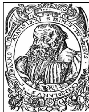
Primož Trubar, oča prve slovenske knige