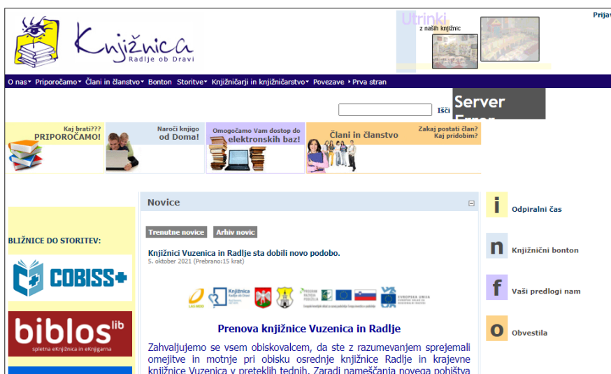
Slika 6: Domača stran Knjižnice Radlje

Spletišče je bilo pred leti najbrž zelo sodobno, dandanes pa žal ne več.