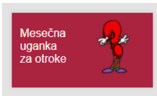
Slika 5: Zajem zaslona dela domače strani Knjižnice Ilirska Bistrica, kjer je povezava do mesečne uganke

Kot ustrezno za otroke ocenjujemo mesečno uganko, ki je pod koledarjem na desni strani domače strani.