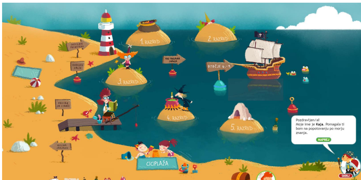
Slika 11: Začetna stran za registrirane uporabnike na portalu UČIMse.com

Poleg vsebin pa je treba pomisliti tudi na oblikovno plat. Otroci kot neveščji uporabniki miške zaradi še nerazvite fine motorike dosti lažje uporabljajo tablico. Pisave, povezave, gumbi ipd. morajo biti dovolj veliki, da ne bodo povzročali težav majhnim prstkom. Treba je poskrbeti tudi za privlačen videz, saj zdajšnje belo ozadje precej spominja na prazen zvezek. Dobre grafične (in seveda tudi vsebinske) rešitve so uporabljene na portalu založbe Mladinska knjiga UČIMse.com. Na našem spletnem mestu bi si želela podobno oblikovane podstrani, kot je na primer na Sliki 11, kjer bi otroke klik na posamičen del slike otroke preusmeril na ustrezne vsebine.