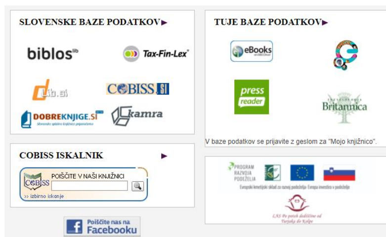
Slika 7: Predstavitev e-virov na starem spletišču Knjižnice Miklova hiša

Baze podatkov so razdeljene glede na jezik – slovenske ter tuje baze podatkov. S klikom na logotip posamičnega elektronskega vira se nam odpre domača stran vira. Na spletnem mestu ni navodil za uporabo elektronskih virov, z izjemo skromnega navodila v okvirčku Tuje baze podatkov.